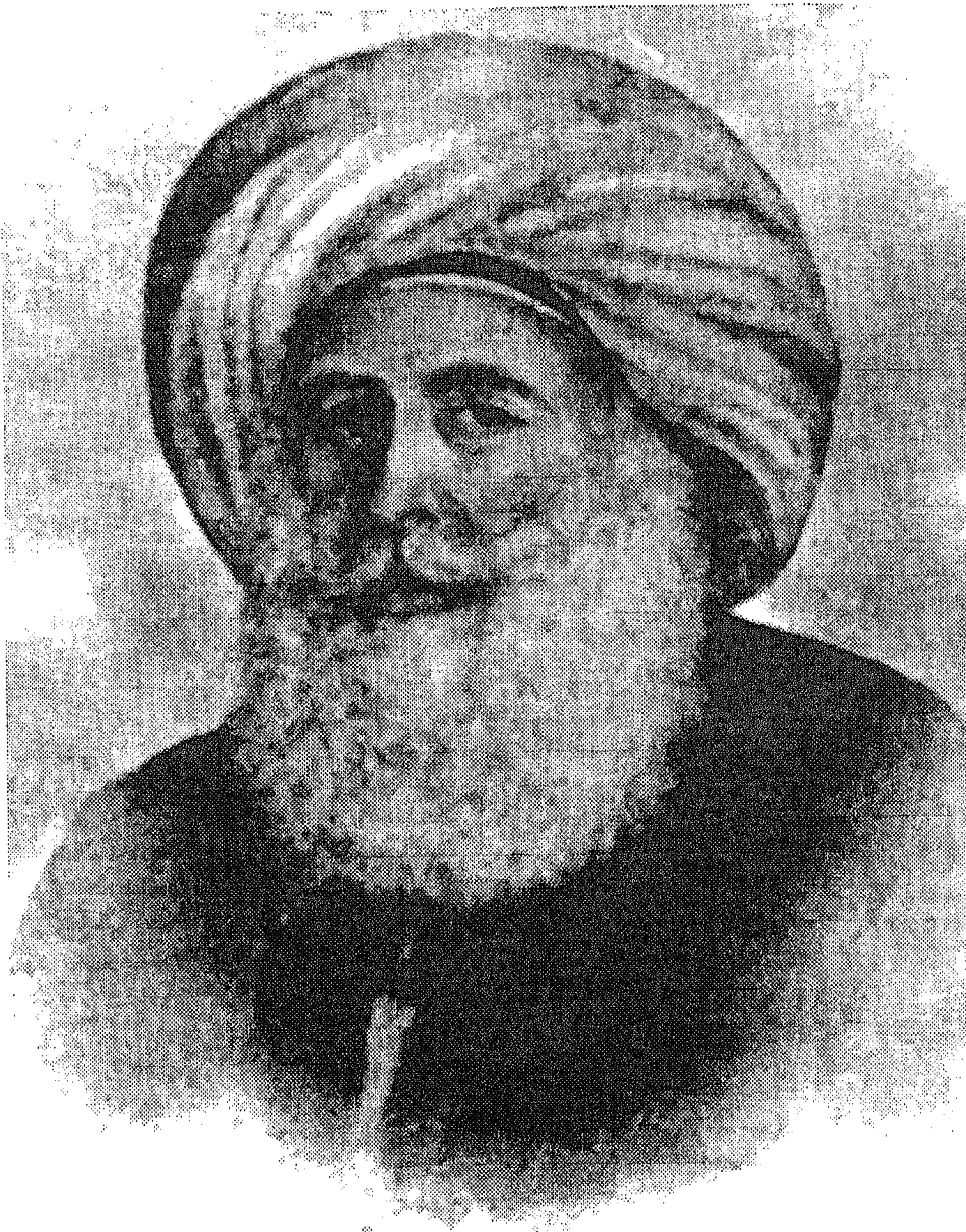
محمد علی باشا ۱۷۶۹ - ۱۸۴۹