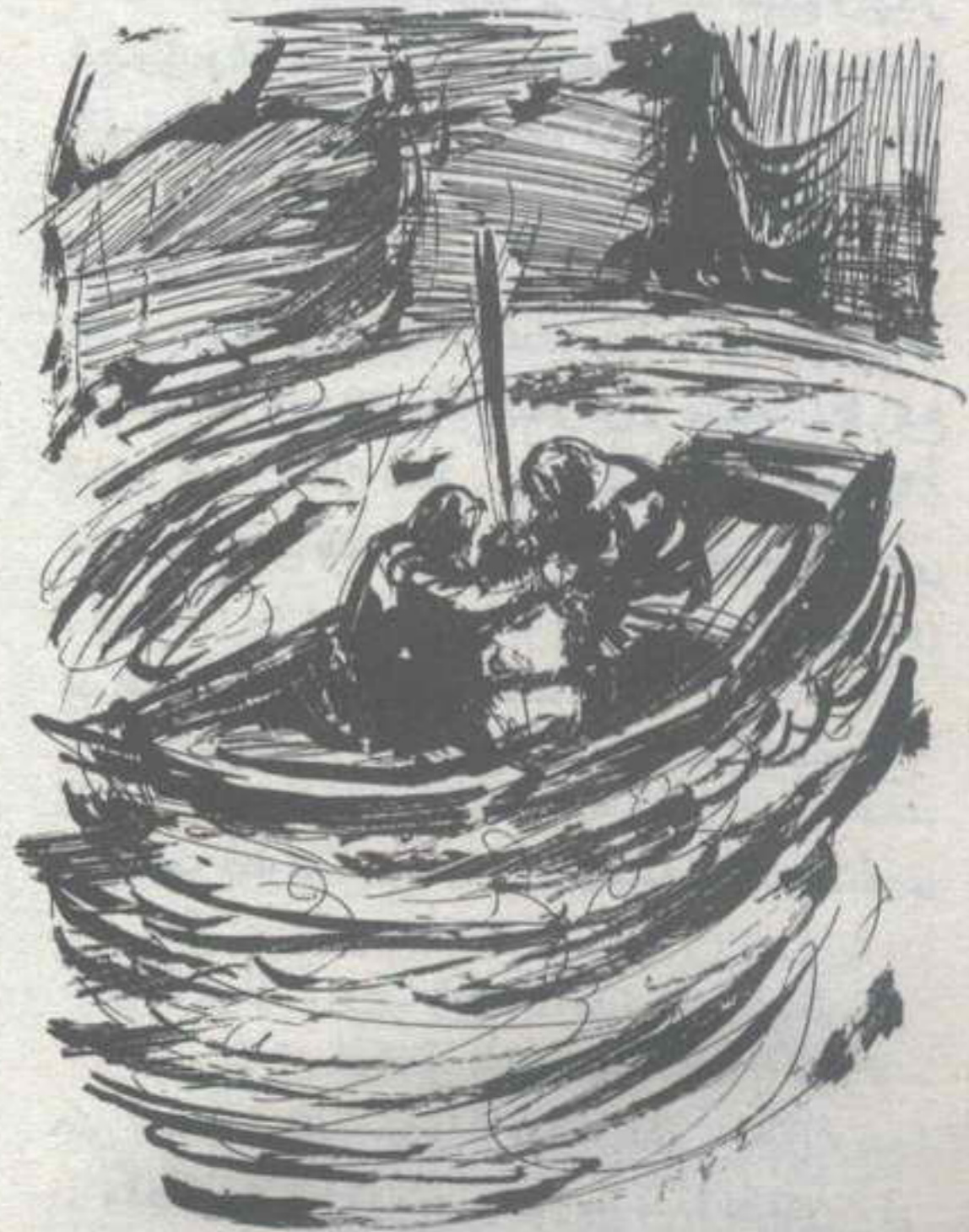
إننا نصعد .. وهذا يعنى نهاية رحلتنا إلى مركز الأرض ..