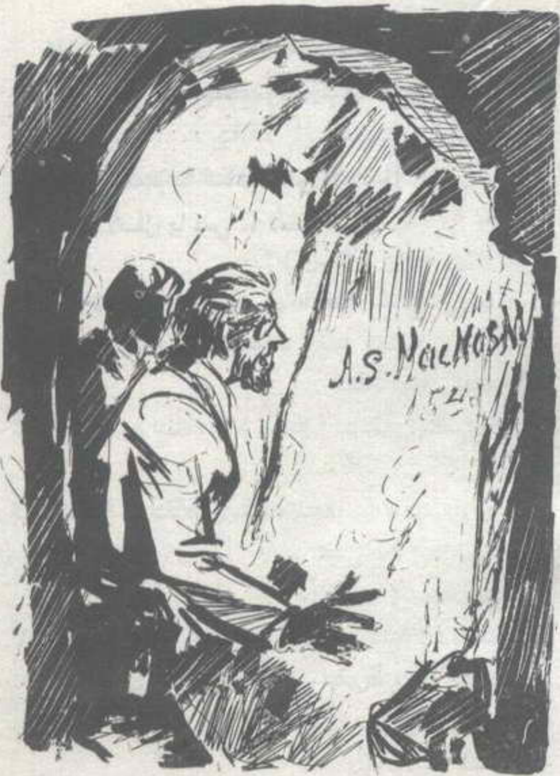
وفجأة .. وبين حائطين من الصخور رأينا فتحة نفق مظلم كبير .. وعلى الجرانيت رأينا حروفاً محفورة ..

وأراد أن يحفر اسمه على صخرة بهذه السكين !.. سرنا جوار الصخور نبحت هنا وهناك متفحصين كل شق .. وفجأة .. وبين حائطين من الصخور رأينا فتحة نفق مظلم كبير ..