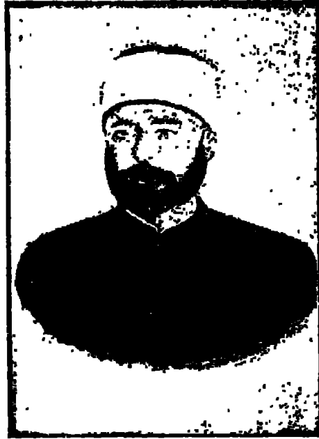
السيد عبد الرحمن الكواكبي