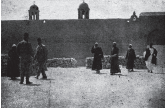
شكل ١-٣: دير السيدة براموس.

قال ابن فضل الله العمري العالم الجغرافي العربي الكبير المتوفي عام ٧٤٨هـ (١٣٧٤م) في كتابه (مسالك الأبصار في ممالك الامصار) ج ١ ص ٣٧٤ تحت عنوان (الديارات السبع) ما نصه: