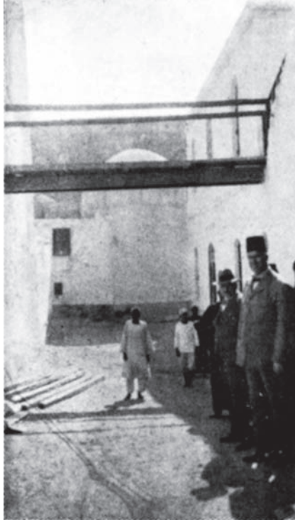
شكل ٣-٦: معبر بدير السوريان.

وأصحاب هذه الأديرة الأربعة وجدوا في عصر واحد وكلهم كانوا يعيشون في القرن الرابع الميلادي. وأول من توفي منهم ماكسيم ودوميس. ومن المحتمل أن وفاتهما كانت في الربع الأخير من هذا القرن. ودير البراموس الذي يسمى أيضًا دير الروم نسبة اليهما أقيم في الموضع الذي دفنهما فيه القديس مقار. وتوفي هذا القديس قبيل عام ٣٩٠ م. وكان لغاية هذا التاريخ لم يقم البربر بشن غارة ما. أما القديسان الآخران وهما الانبا بشوي والقديس يوحنا القصير فعمرنا بعض سنين من القرن الخامس الميلادي وكلاهما ترهب على يد الأنبا بماوه "Anba Bamaweh" وهذا هو الذي جعلهما يعتنقان معيشة الرهبان في صحراء شيهات. وشاهد كلا الاتنين غارة