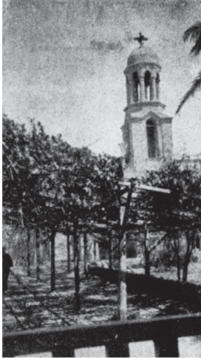
شكل ٣-٧: معبر و برج بدير برموس.

الحياة الدنيا قبيل منتصف هذا القرن. وهذا يطوحنا مراحل كثيرة بعيداً عن الحقبة التي نتكلم الآن عنها وينشأ عنه فرق يقدر بزهاء ٩٠٠ عام بين التاريخين. وهذا اعتراض وجيه يقوم في وجه من يزعم بأن هذا القديس هو صاحب الدير القائم النزاع بصدد مؤسسه. إلا أنه من المحتمل أن الصوامع التي كان نازلاً بها هو وأخوته أبقى عليها الرهبان الذين سكنوها بعده وأنهم في الوقت الذي شيّدوا فيه الدير أطلقوا عليه اسمه.