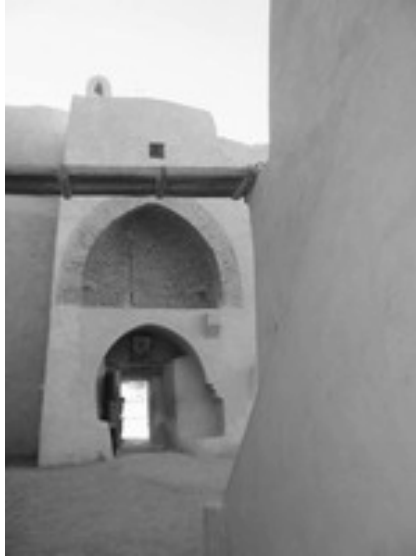
شكل ٣-٥: معبر بدير القديس مقار.