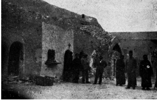
شكل ٣-٩: أبواب صوامع بدير الأنبا بشوى.

أما بقية الأديرة الأخرى فلم يبق منها إلا أطلالها. وقد روى لنا الأب المذكور في الصفحة ٣٠ من مؤلفه السابق، أن عظام القديس يوحنا القصير محفوظة في دير القديس مقار. أما دير القديس يوحنا القصير فقد ذكر أنه تخرّب تخرّبًا تامًّا. وقد قال بوجود شجرة الطاعة التي كانت قائمة في أنحائه.