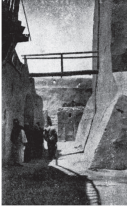
شكل ٣-٨: حديقة دير السيدة برموس.

ولكن لا شيء محال وما ذلك إلا لأننا رأينا جثتي القديس يوحنا القصير والأنبا بشوي نقلتا من مسافات شاسعة جدًا. فنقلتا أولاهما من كليهما (القلزم) بجوار السويس بعد وفاة صاحبها بثلاثمائة وخمسين عامًا. ونقلت الثانية من انتينويه (انصنا) في أعالي مصر. وعلى كل حال إذا كانت هذه الشخصية هي نفس صاحب الدير المذكور فمن الأمور التي لا ريب فيها أن جثته لا بد أن تكون قد نقلت إلى وادي النطرون، وأن يكون نقلها هو السبب في بقاء ذكره في هذا الوادي.