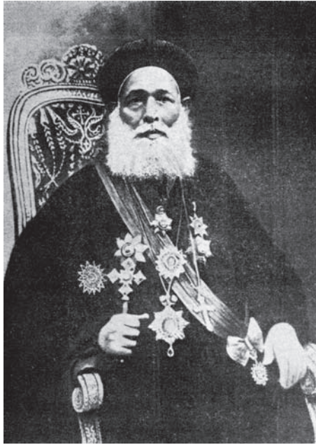
حضرة صاحب الغبطة الأنبا يوانس، بابا وبطريك الكرازة المرقسية الثالث عشر بعد المائة.