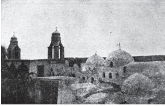
شكل ٣-٣: دير السوريان من الداخل.