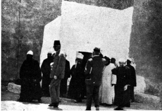
شكل ٣-١٠: باب الخروج بدير السيدة برموس.