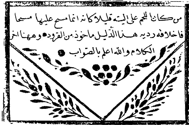
الصفحة الأخيرة من المخطوطة