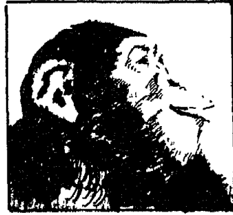
(شكل ٢) أثر الانفعال على الحيوان