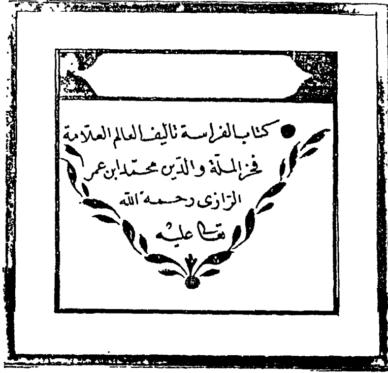
الصفحة الأولى من المخطوطة