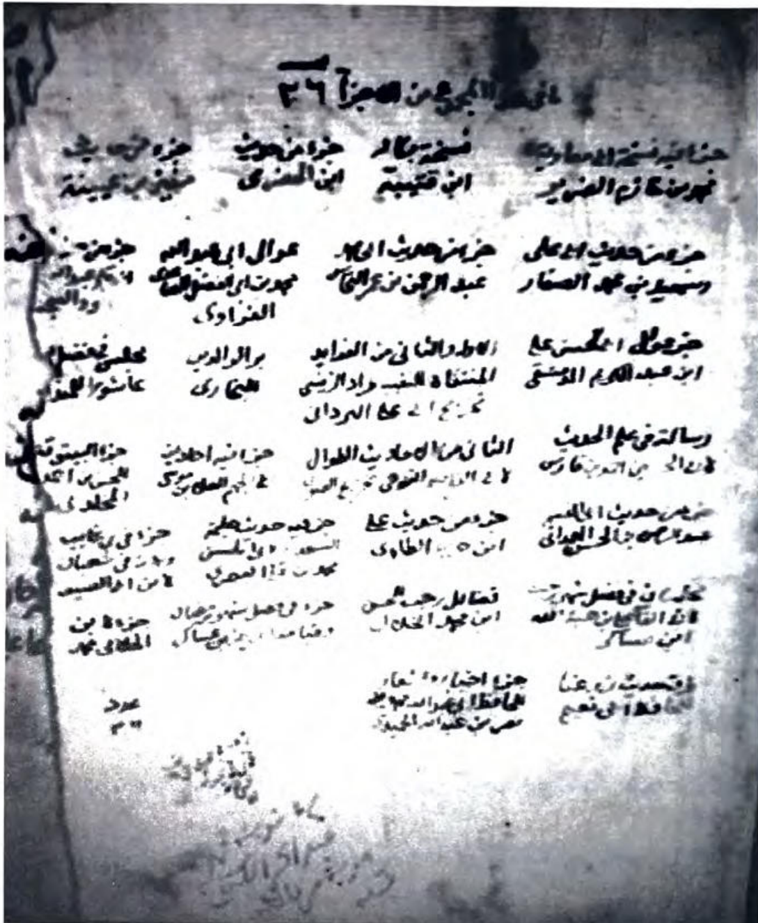
طرة مجموع رقم ٤٥٢ لنسخة مكتبة القصر الملكي العامرة بمراكش وبه أسماء الرسائل التي تضمنها