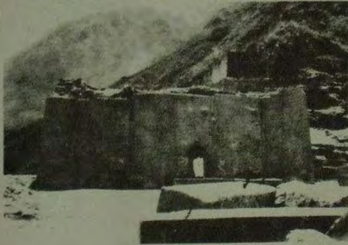
حصن أوليانتاتيامبو. تصوير إرنستو جيفارا. إبريل/نيسان 1952.

”متبعين مسلك فيلكانو مروراً ببعض المواقع غير المهمة نسبياً، وصلنا أوليانتاتيامبو، حصن شاسع حيث قام الأنكا امونكو الثاني بحمل السلاح ضد الإسبان مقاوماً قوات هيرناندو بيزارو ومؤسساً سلالة الأنكا الرابعة.”