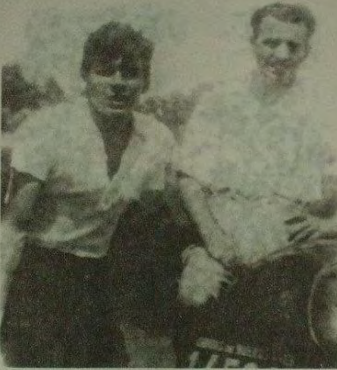
إرنستو جيفارا وألبيرتو جرانادو

“كانت مهمتي الرئيسية قبل المغادرة أن أمتحن في أكبر عدد ممكن من المواد، وعلى ألبيرتو تحضير الدراجة للرحلة الطويلة، ودراسة وتخطيط درينا.”