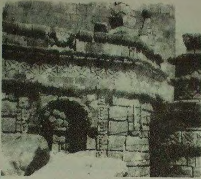
صورة تفصيلية لكنيسة سانتو دومينغو القائمة فوق أطلال "معبد الشمس". إبريل/نيسان 1952.

سويت معابد أنتي بالأرض حتى أساسها أو أن جدرانها شيدت للارتقاء بكنائس الدين الجديد: بنيت الكاتدرائية فوق بقايا القصر العظيم وأقيمت فوق جدران "معبد الشمس" كنيسة سانتو دومينغو، لتكون درساً وعقاباً فرضه الفازي المختال.