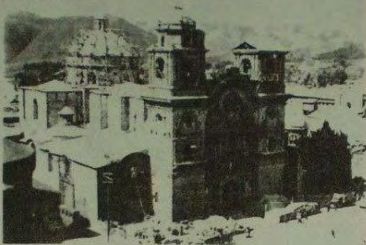
كاتدرائية ماريا أنغولا. إبريل/نيسان 1952.

دفعت حكومة الجنرال فرانكو (الإسبانية) تكاليف ترميم أبراج نوافيس الكاتدرائية التي هدمتها هزة أرضية عام 1950، وكإيماءة عرفان صدرت أوامر للفرقة الموسيقية بعزف النشيد الوطني الإسباني... لا يمكنني الجزم إن حدث ذلك بحسن أو سوء نية، إذ أن الفرقة عزفت (عوض ذلك) النشيد الجمهوري الإسباني.