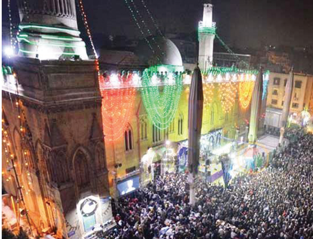
مولد الإمام الحسين