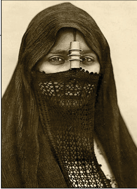
زي المرأة القاهرية في زمن الحملة الفرنسية

لتصبح أول «مقصوفة رقبة» يعلن عنها في تاريخ مصر :