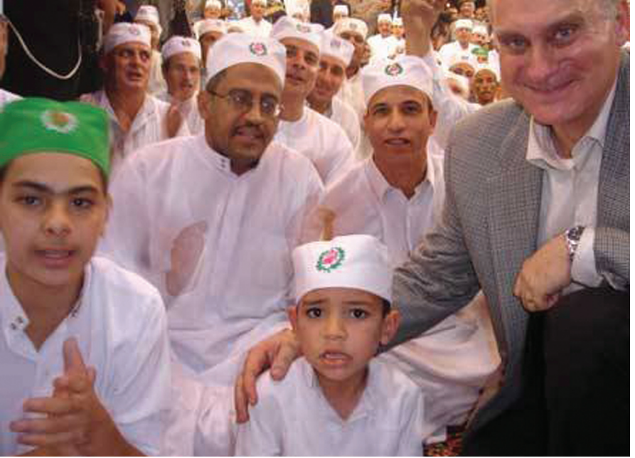
السفير الأمريكي ريتشارد دوني يشارك الطرق الصوفية احتفالها بمولد السيد البدوي