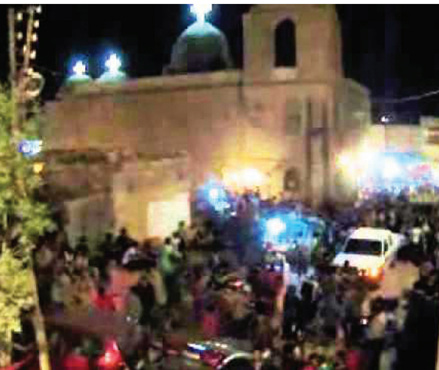
مولد السيدة العذراء