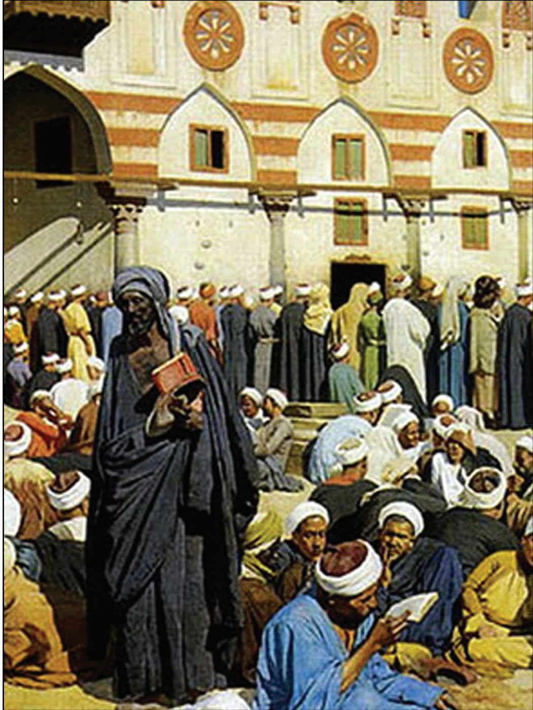
كان شيوخ الأزهر غارقين في النعم من عطايا المماليك والعثمانيين والفرنسيين .. والمجارون غارقون في البؤس!!