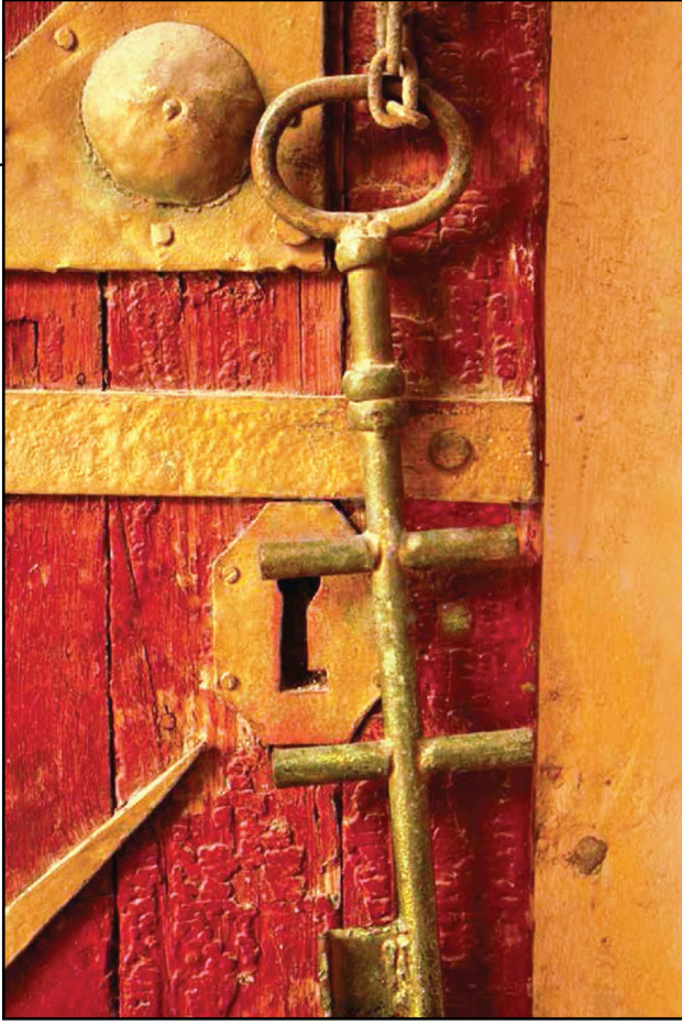
صورة لمفتاح أحد أبواب الحارات التي هدمها الفرنسيون

إليهم أفراجاً، فنططن الحيطان، وتسلقن إليهم من الطبقان، ودلوهم على مخبات أسيادهن وخبايا أموالهم ومتاعهم وغير ذلك».