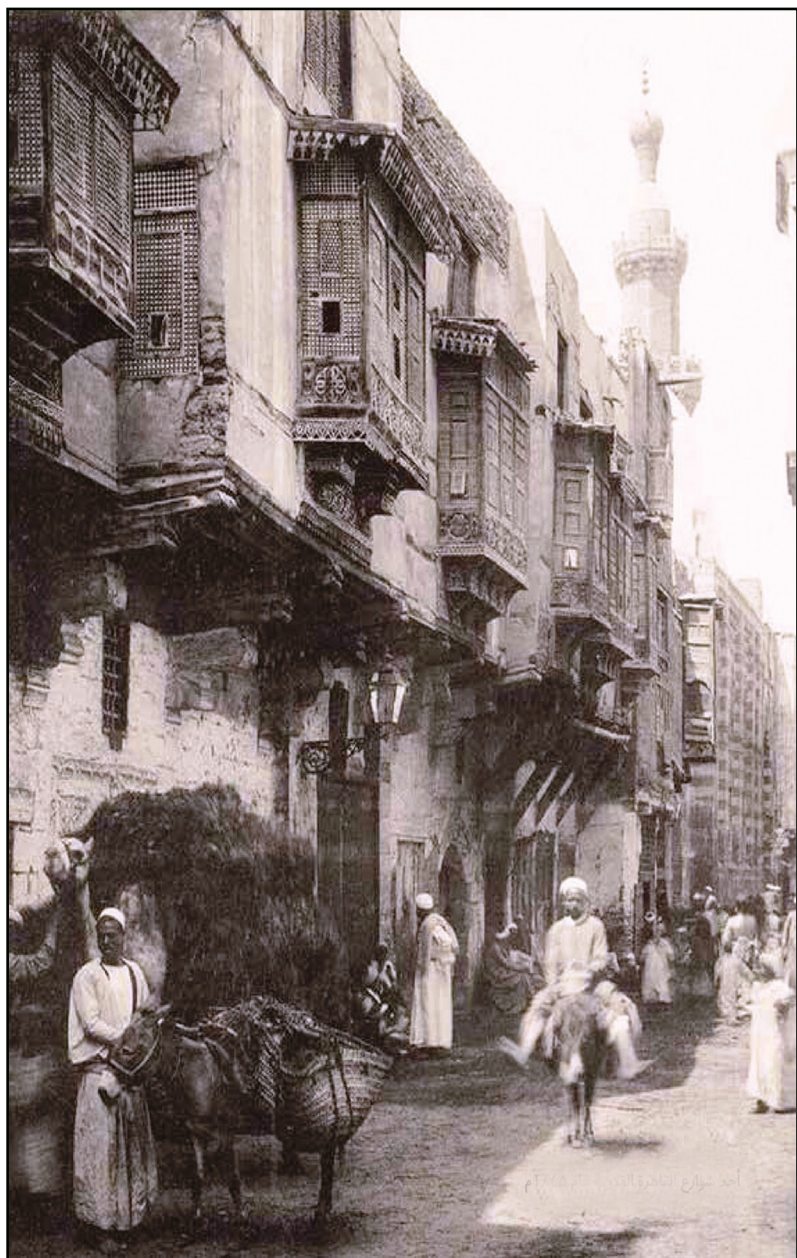
أحد شوارع المحروسة في زمن الحملة الفرنسية