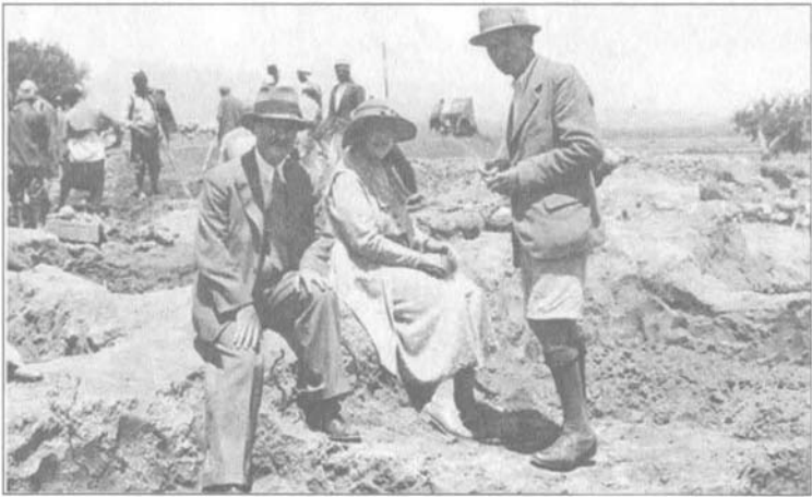
أغاثا كريستي مع زوجها ماكس مالوان (يسار) وعالم الآثار البارز ليونارد وولي في أور.