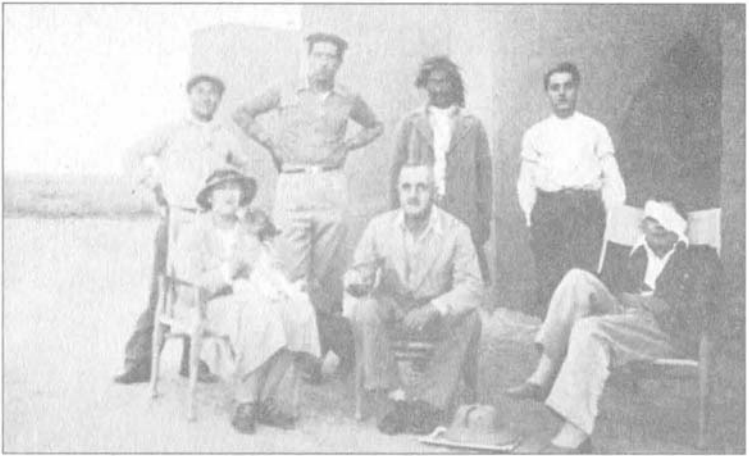
أغاثا كريستي، ماكس مالوان (وسط) وبقيّة أعضاء الفريق الأثري في سورية.