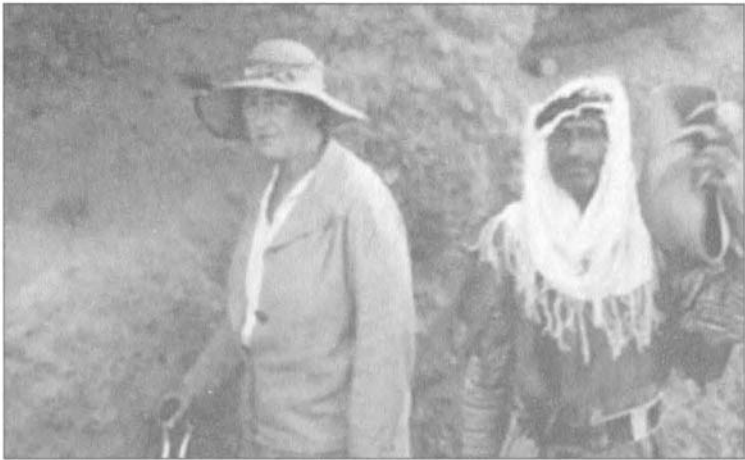
أغانا كريستي في تل شاغر بازار، سوريا بين ١٩٣٥ و ١٩٣٧.