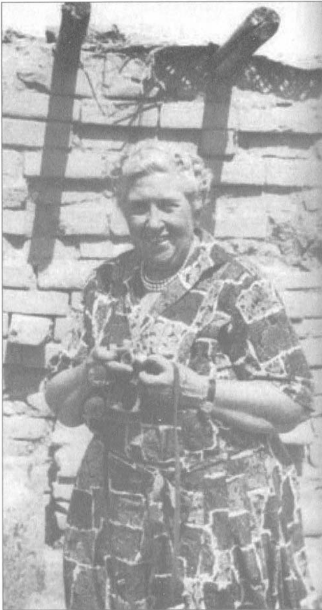
أغاثا كريستي في النمرود الموصل.