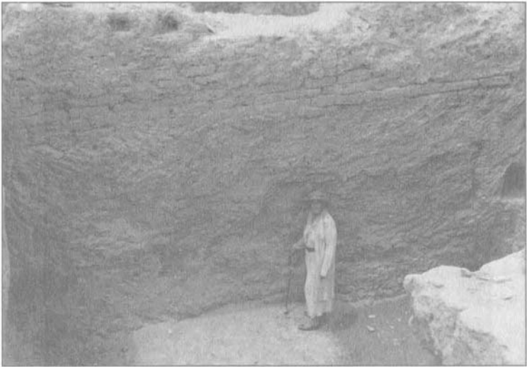
أغاثا كريستي في موقع تل شاعر بازار (١٩٣٥-١٩٣٧).