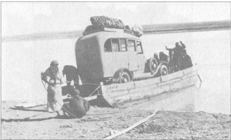
سيارة كوين ماري على الفرات خلال رحلة كريستي السورية.