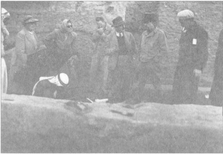
أغاثا كريستي مالوان، ملكة جمال باركر، إيرين هاينز، كارل هاينز، ماكس مالوان، دون ماك كوان، محمد علي، تل حلف.