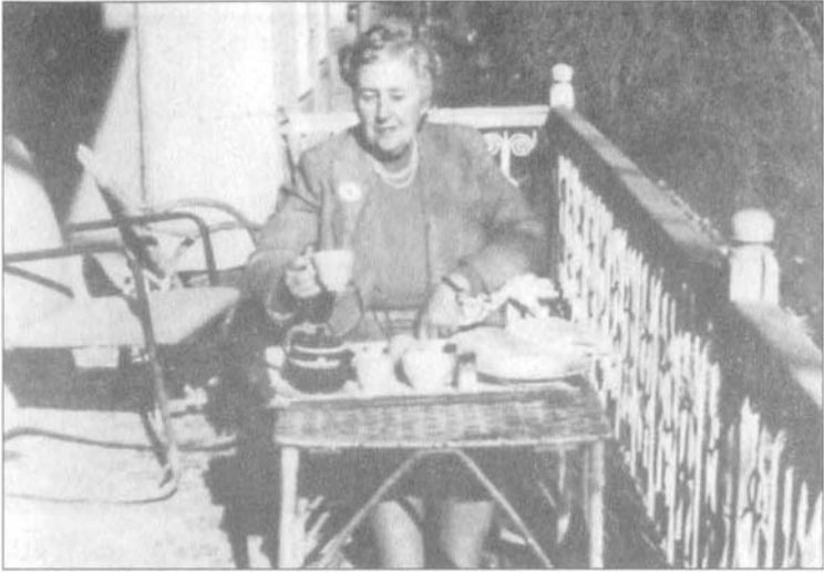
أغاثا كريستي تتناول الإفطار على الشرفة في منزل ببغداد.