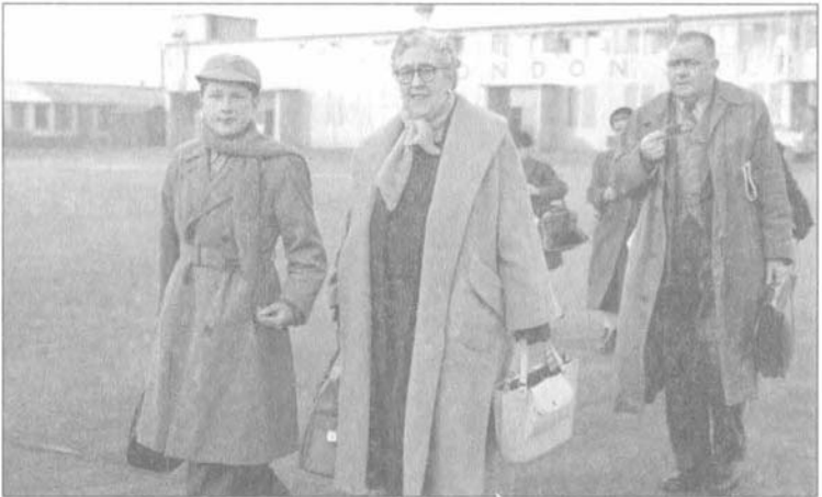
أغاثا كريستي مع حفيدةها ماثيو بريتشارد في مطار لندن في ديسمبر كانون الأول عام ١٩٥٦.