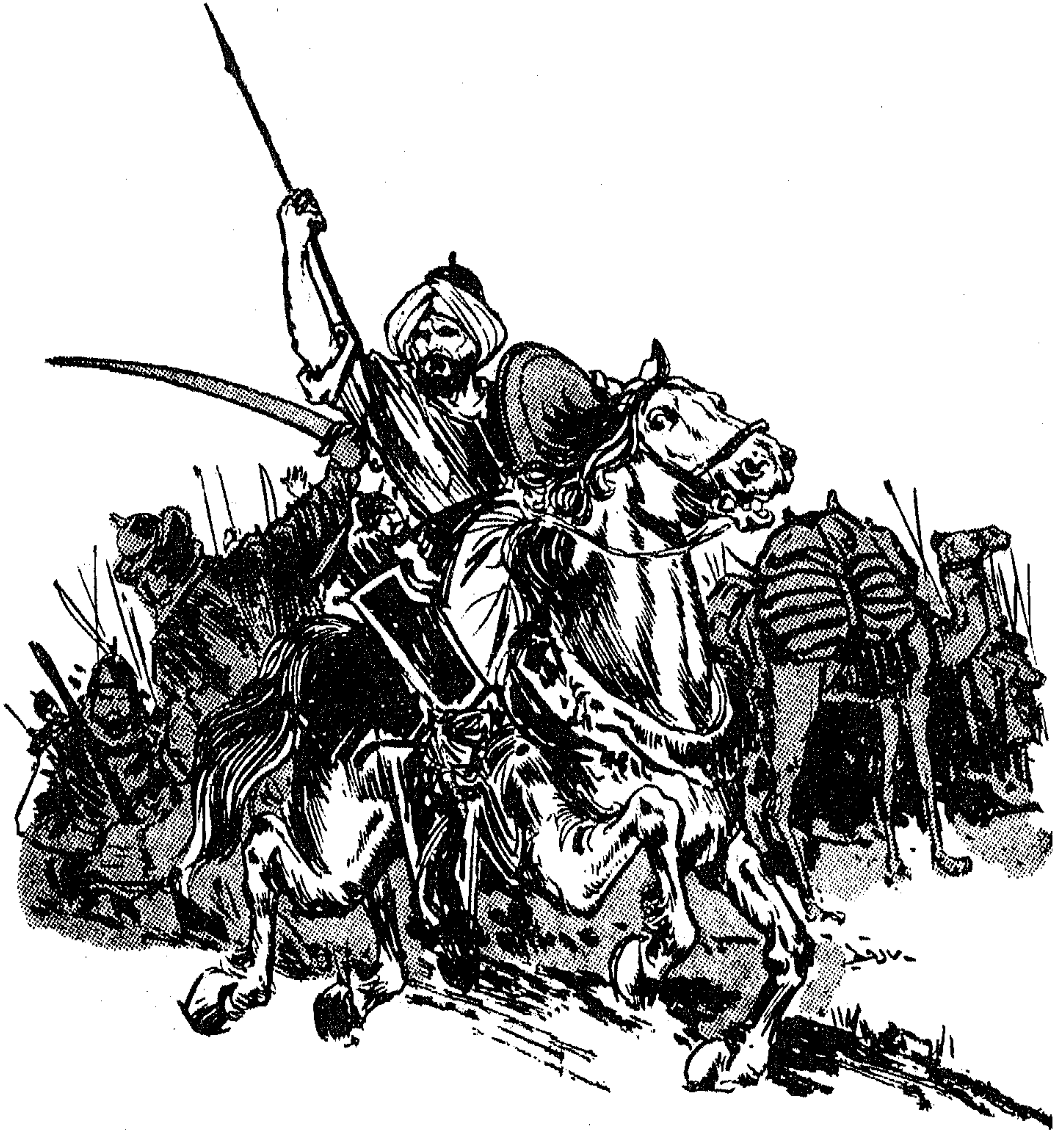
هجم سعد علی قریش کا لاسد عادی