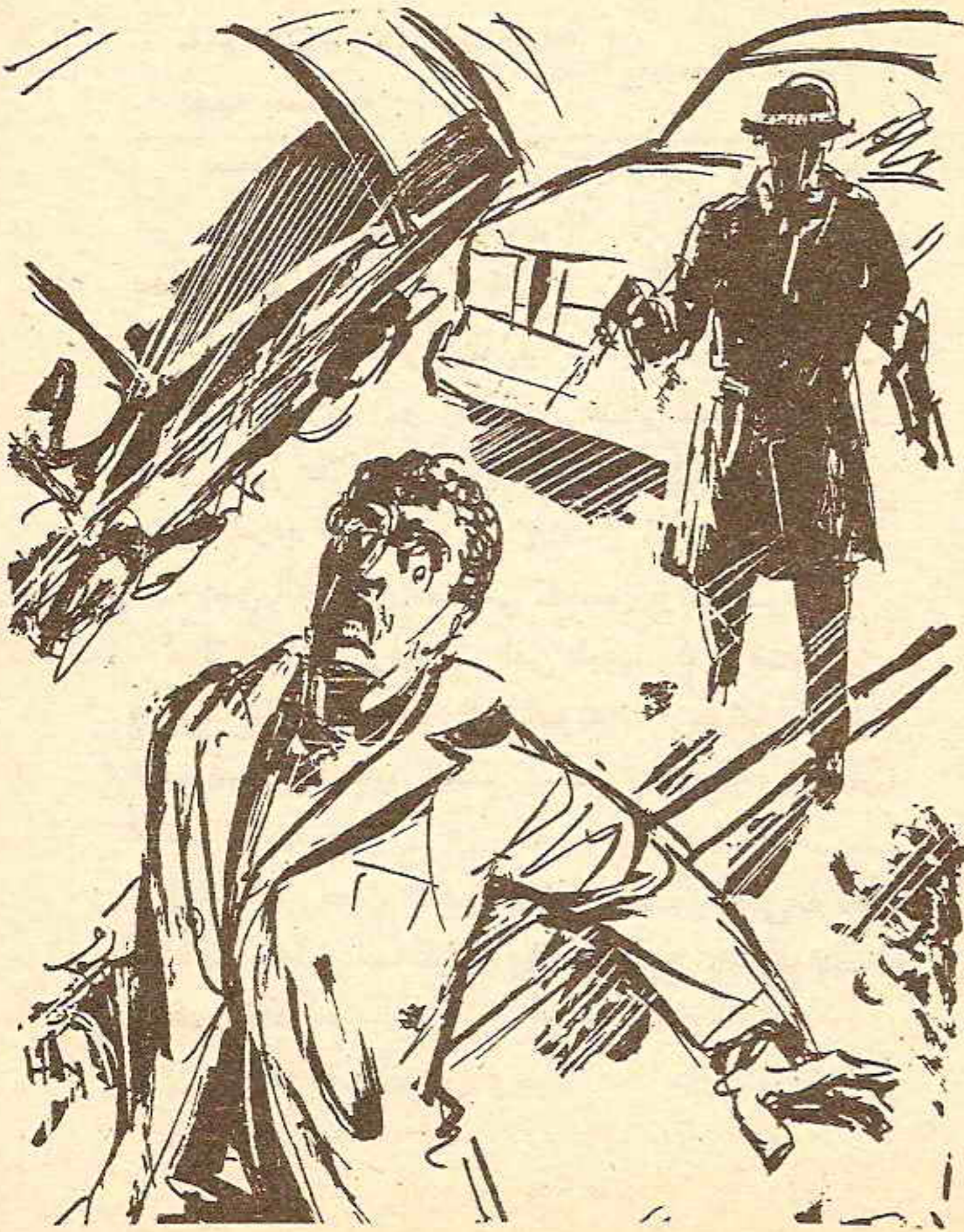
وانطلقت ثلاث رصاصات أصابته اثنتان منها ..