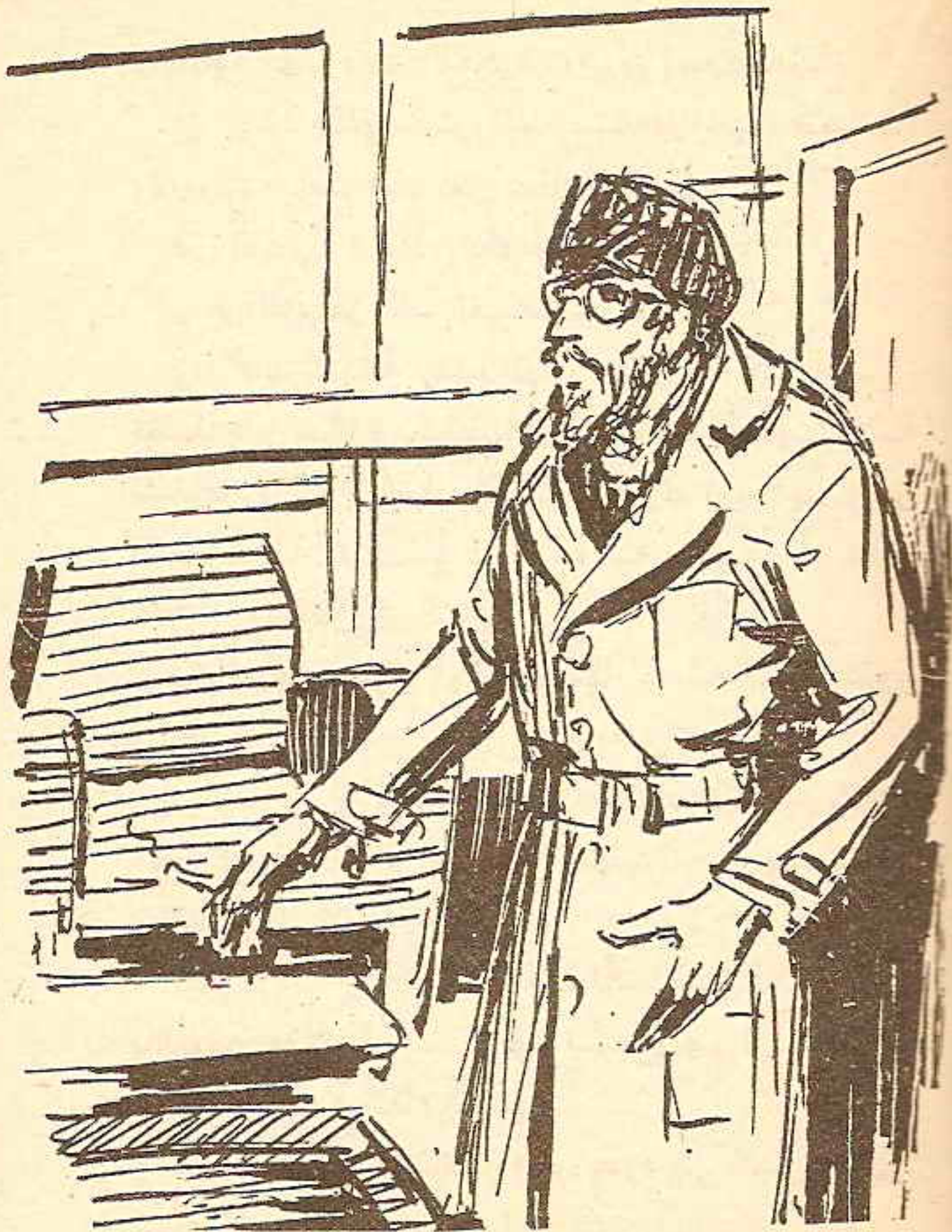
تلفت الدكتور ( تاكد ) حوله ، وهو يتفحص جوانب الحجره