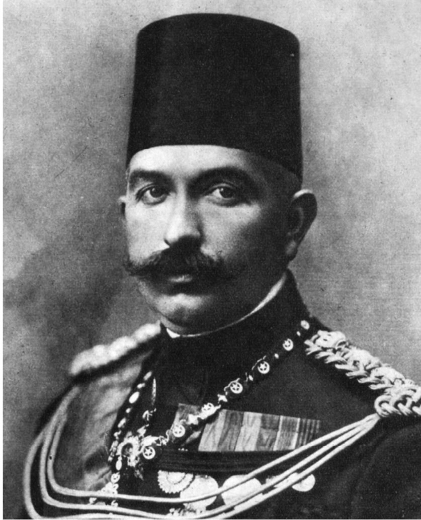
الخدوي عباس حلمي الثاني