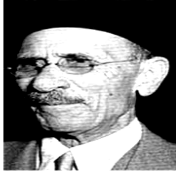
أحمد لطفى السيد