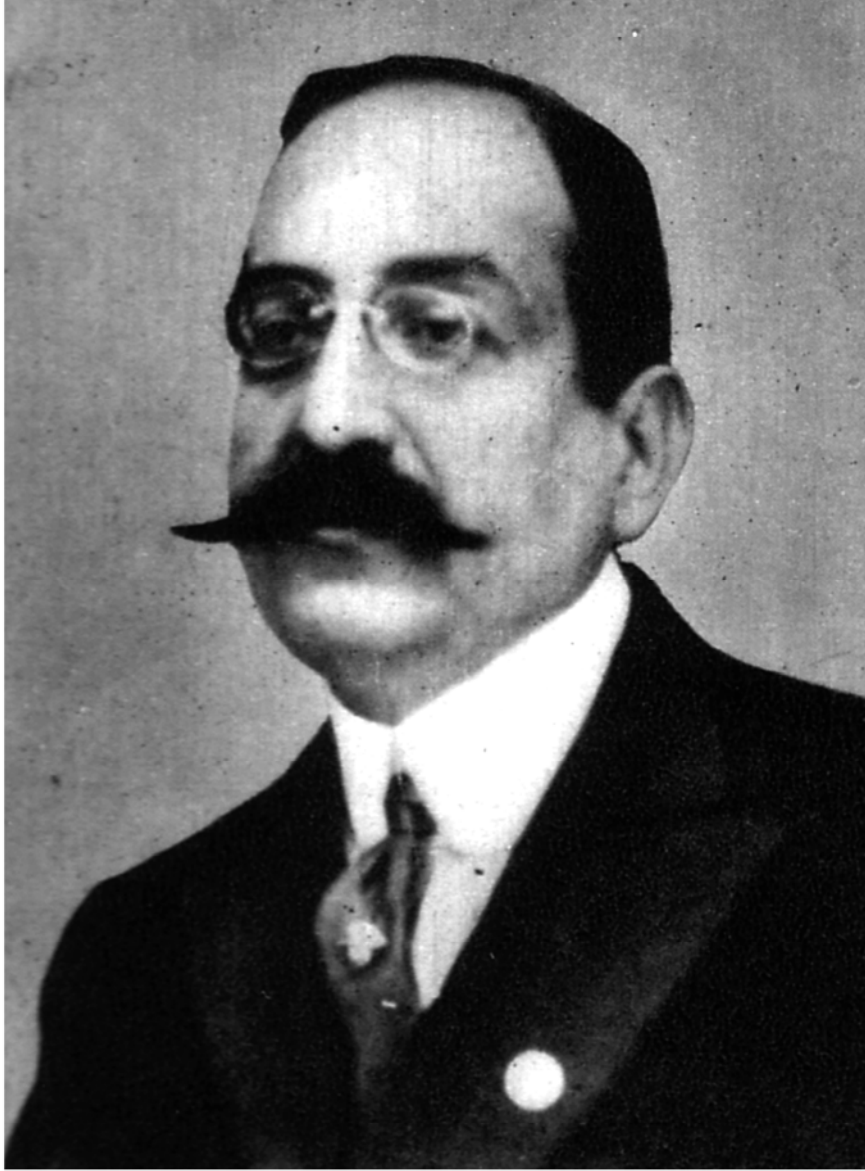
محمد بك فريد