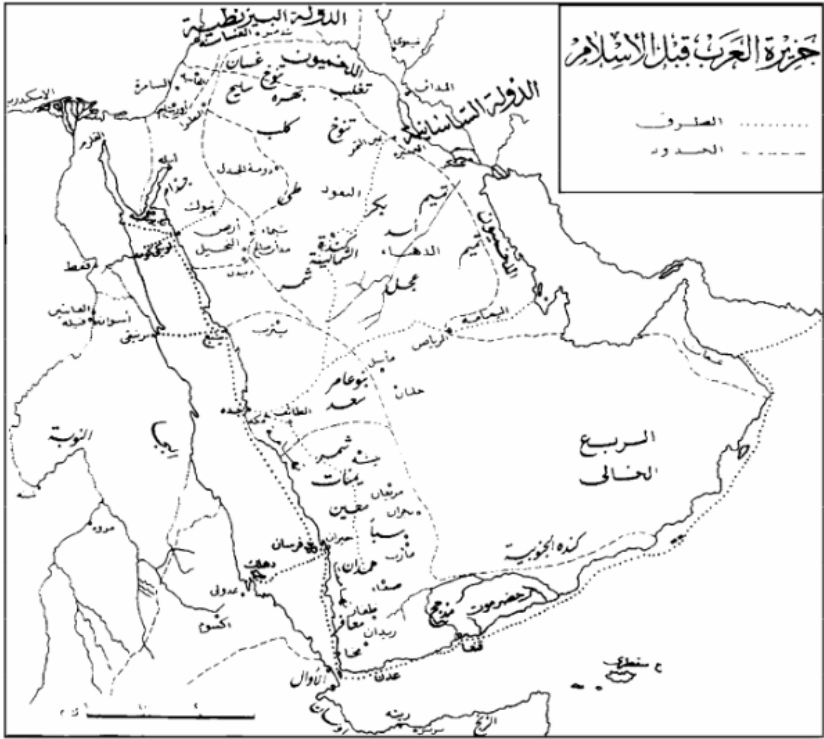
عن كتاب (الأحباش في تاريخ اليمن القديم)، د/ علي الأشبیط.