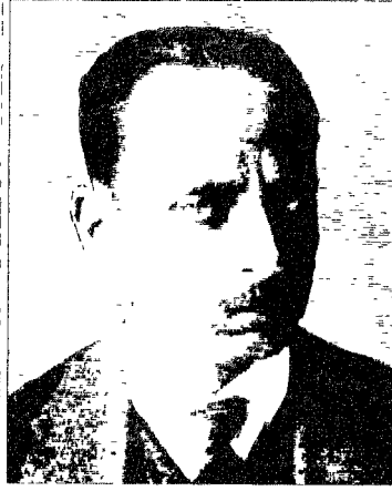
ريلكه زمن المراثي

حقاً ، غريبٌ الأ نَسْكُنَ الارضَ بَعْدُ ، الأ نُمَارِسَ عَادَاتِ تَعَلُّمِنَاهَا ، الأ نُعْطِي الْوَرُودَ وَأَنْبِيَاءَ أُخْرَى وَاعِدَةَ مَعْنَى مُسْتَقْبَلِ بَشَرِي ، وَألاً نَظْلُ ، كَمَا كُنَّا ، فِي يَدَيْنِ خَانِقَتَيْنِ بِلَا نِهَائِيَّةِ ، وَأَنْ نَرْمِي بِأَسْمَانِنَا جَانِبَا كَلْعِيَّةِ مُحْطَمَةٍ . غريبٌ الأ نَسْتَمِرُّ بِرَغَائِبِنَا . غريبٌ أَنْ نَرَى الْعِلَاقَ كُلَّهَا فِي الْفِضَاءِ مُحَلُولَةً تَتَبَعِشِرُ