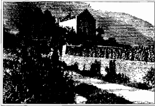
قصر مودو في سويسرا ، مسكن ريلكه من ١٩٢١-١٩٢٦ ، حيث ادهت تجره المراتى .