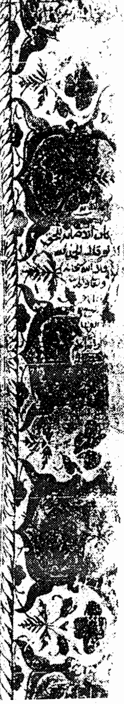
الورقة الاولى / ب من النسخة (خب)

ما تقول السادة العلماء ائمة الدين رضي الله عنهم اجمعين في رجل استبى ببلية وعلم انها استمرت به افسدت دينه وخرقه وقد اجتمعت في دفعها عن نفسه بكل طريق فيما يرد الا توعد وسئله في المسئلة في دفعها وما الطريق الي كشفها فرحم الله من اعان مستبى والله في عون العبد ما كان العبد في عون احبه اقولنا ما جاوز رحمة الله قال الشيخ الامام العالم العلامة مفتي المسلمين محمد بن ابي عبد الله ابن ابي بكر بن ابي الوهب امام المدينة ربه الجور به رحمة الله ورضوانه الذي له نبت في صحيح البخاري من حديث ابن هروير رضي الله عنه عن النبي صلى الله عليه واله وسلم انه قال ما اتى الله البيان داء الا انزل له شفا وفي صحيح مسلم من حديث جابر بن عبد الله قال قال رسول الله صلى الله عليه واله وسلم لكل داء دوا فاد الصيب دوا الله يريك داءه وفي مسند الامام ابن ابي عمير من حديث عائشة بنت النبي صلى الله عليه واله وسلم قال ان الله لم ينزل داء الا انزل له شفا علمه من علمه وجعله من جهله وفي لفظ ان الله لم يضع داء الا وضع له شفا الداء واحدا فقالوا يا رسول الله وما هو قال العسر قال النبي هذا حديث صحيح وهذا يعجز الله والقلب والروح والبدن وادويتها وقد جعل النبي صلى الله عليه واله وسلم الجهل داء وجعل دواءه سؤال العلماء فروى ابو داود في سننه من حديث جابر بن عبد الله قال خرجت في سفر فاصاب رجلا منا بجر فسميت في راسه ثم اجتمعت فسال اصحابه فقال هل تجدون في رخصة في انيهم قالوا ما نجد لك رخصة وانت تقدر على الما فاعتسل فيما فلما قد ما على رسول الله صلى الله عليه واله اخبرته بك فقال فتلوه فقام الله ان سألوا انهم يعاموا فاما سفالتي المور انما كان يكتفي ان يجمع ويغسل او يغتسل على جرحه خرقه ثم مسح عليها ويغسل ساير جسده فاخبر ان