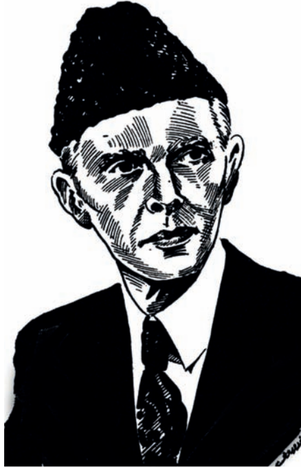
محمد علي جناح.