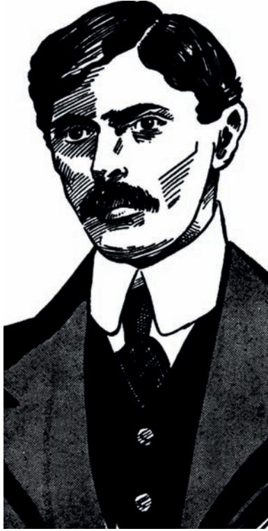
محمد علي جناح في شبابه.

على أن موضوعاته التي أُلِع بها في إنجلترا قد تنبئ عن الموضوعات التي كان يجنح إليها بتفكيره وميول نفسه منذ طفولته الأولى، وأوفر هذه الموضوعات نصيباً من إقباله وعنايته دروس القانون والأدب، ومراجع التاريخ من ناحيته السياسية على الخصوص. كان يتعلم القانون رغبة واستعداداً لا لمجرد التوسل به إلى مناصب القضاء والإدارة، وكان ذهنه من أذهان الفقه والمحاماة والفصاحة الخطابية طبعاً وفطرة لا تعلماً ومراساً بالصناعة.