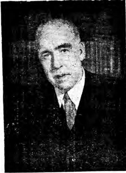
نيلز بوه في سن السبعين

رئيس قسم النظائر المشعة بمؤسسة الطاقة الذرية