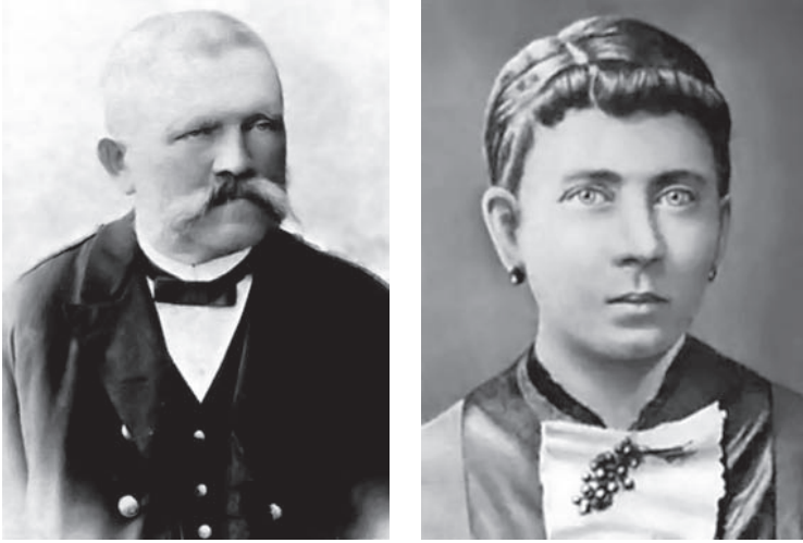
أبو هتلر وأمه.

ولم يكن أبوه متين البنية ولا كان قدوة في الوفاء وضبط النفس وبراءة النشأة، بل كان عرضة لنوبات الفالج تعتريه من حين إلى حين، وكان سريع الزواج بعد وفاة زوجاته، وكانت ولادته كما تقدم في غير مهد الزفاف المشروع. فهل ورث هتلر ما يورث من هذين المزاجين؟ لقد كانت أمه تقول له في طفولته إنه صريع القمر Mondsüchtig وهي كلمة تقارب عندنا كلمة «المجذوب» ١ والذين عاشروه مجمعون على نزقه وسرعة بكائه وكثرة هياجه وتقلب أطواره، ويقول روشننج Rauschnig رئيس مجلس الشيوخ السابق في دانزيغ إنه يتخبط ويتشنج ويستيقظ من نومه وهو صائح مذعور كأنما يهرب من أعداء، والشائع عنه الآن أنه لا ينام ليلة بغير دواء مُرقد إلا إذا كان مبيتته في برختسجاندن حيث يهدأ بعض الهدوء ٢ فإذا أضيف إلى الأثر الوراثي في الجسد أنه نشأ وهو يعلم مولد أبيه في غير مهد