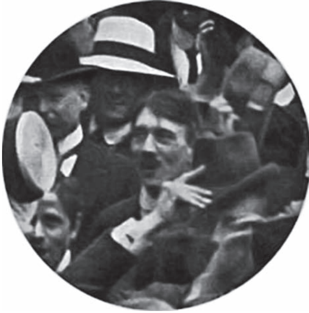
هتلر يسمع إعلان الحرب الماضية سنة (١٩١٤).

فإنكار الجريمة لا ينفي طبيعة الإجرام. وكفى أن يكون الشر سهلاً يواقعه المرء لأيسر ضرورة أو لضرورة موهومة لتثبت طبيعة الإجرام أيما ثبوت. وما ضرورة دانزيج، وما ضرورة تأجيلها أو انتظار اليأس من المفاوضة فيها؟ ليست بضرورة على الإطلاق. لكنها مع هذا كانت أعضل على هتلر من معضلة المغامرة بسلام الدنيا ومصير بني الإنسان.