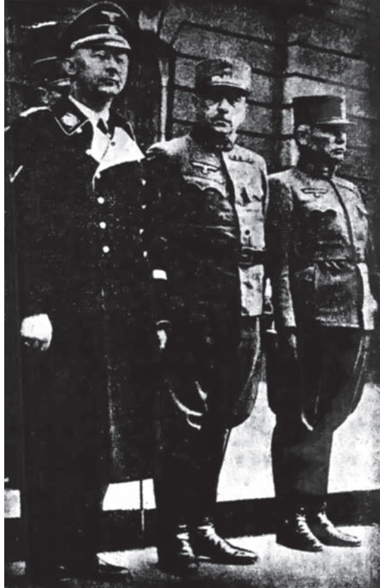
هيملر عين هتلر التي لا تغمض وإلى جانبه ضابطان نمسويان.

للأخبار واختراعًا للجنايات والأكاذيب، وقيامًا «بوظيفة نازية» لا يخطر على البال أن يضطلع بها رجل صادق شريف.