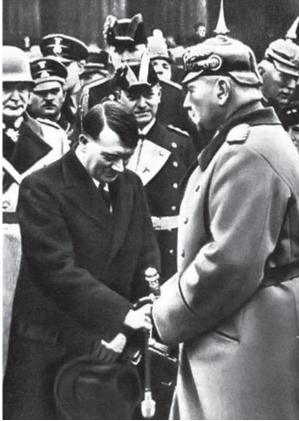
هتلر بين يدي هندنبرج.