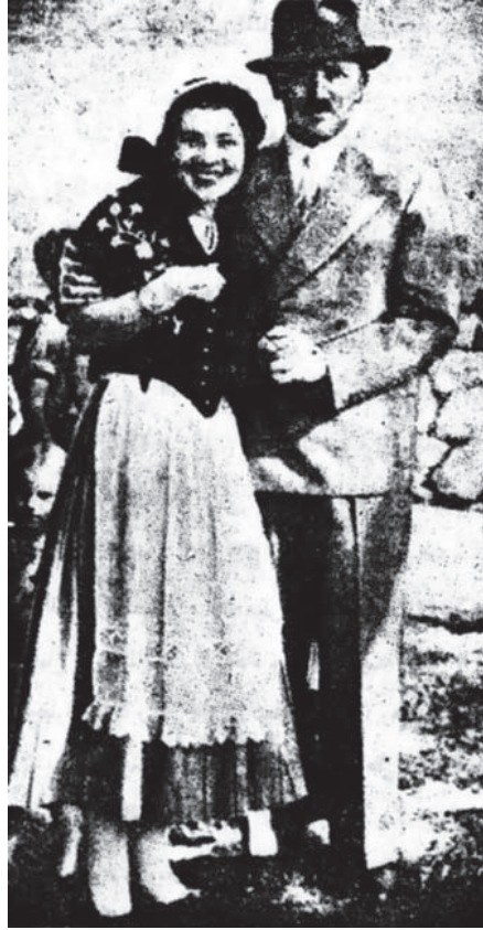
موقف هتلر مع فتاة.

وبعد أشهر قليلة قتل هتلر هذا الصديق والزميل ومئات من رجاله شر قتلة، ووصمه بكل رذيلة من الرذائل التي كان يعلمها ويعتذر عنها بين أصحابه، ولا تمنعه أن يفخر بالصدقة والزمالة للعزيز إرنست روهم. ولم يتقدم هتلر بوثيقة واحدة تُسوِّغ تلك المجزرة الجائحة فيما بين يوم وليلة، مع استيلائه على أزمّة البحث والتحقيق في البلاد الألمانية بأسرها.