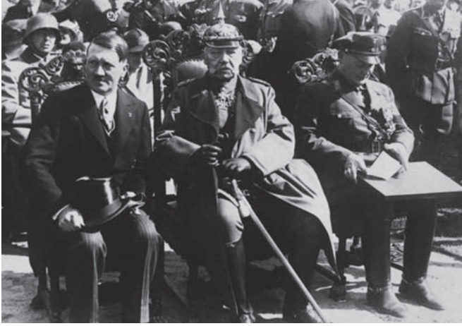
المارشال هندنبرج بين هتلر وجورنج.

إلا أن الحوادث قد خالفت ما قصد من تدبيره، فجرت الانتخابات الجديدة بإشراف المستشار هتلر على الطريقة النازية المعهودة، وصدرت المراسيم بحل جماعات الشيوعيين، واشتد المرض بالمارشال الهرم فأصبح لا يعي ما يقول ولا ما يقال بلسانه، ثم مات وتبوأ هتلر مكانه باسم زعيم الأمة ومستشار الدولة، وأفلتت الأعتة من يدي فون باين فانقاد لسائقه.