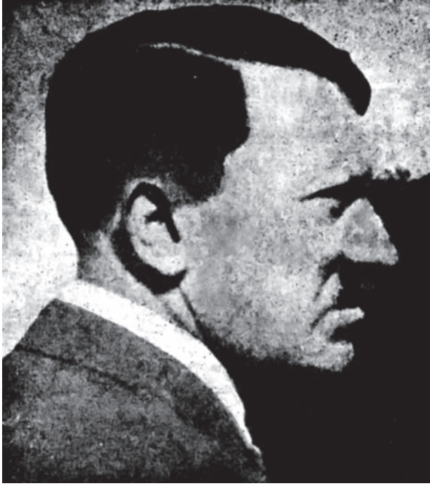
هتلر في نوبة سوداء.