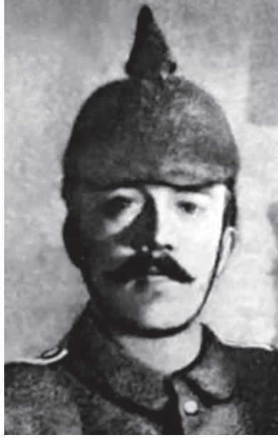
هتلر كما كان في الحرب الماضية.