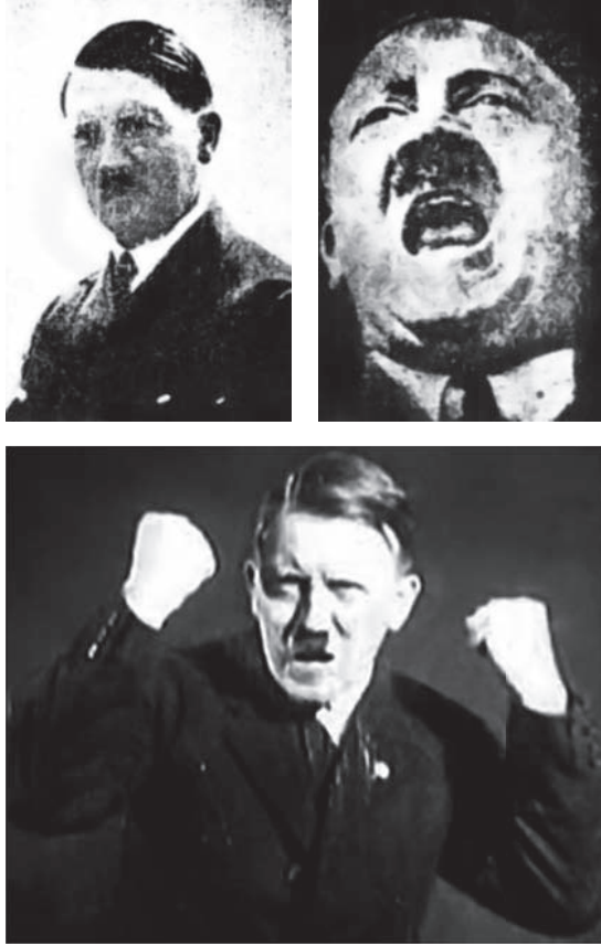
هتلر بين الوجوم والغضب الخطابي.

فالرجل المفطور على عاطفة يساجل بها العواطف، وفكرة يقابل بها الأفكار، يقول ويسمع، ويستميل الفرد بالوسائل التي يستمال بها الأفراد، مرةً بالإيحاء ومرةً بالدليل ومرةً بالشرح المفهوم، وفي كل مرة بتبادل الثقة والاعتراف بحق المناقشة والاعتراض. أما الرجل الذي نضبت نفسه من جانب العاطفة الفردية، والذي ليس عنده ما يتبادل به مودة بمودة أو فهمًا بفهم أو خاطرًا بخاطر، والذي انقطعت جميع الوشائج