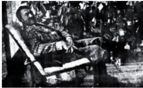
هتلر في حياته الهادئة.