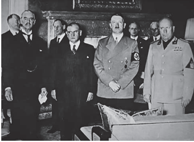
هتلر مع شامبرلين ولدلاييه وموسوليني.

قال لهم البسوا الكساوى والشارات التي تحبونها، واخرجوا في الشوارع صفوفًا صفوفًا تزعمون وتتوعدون، واضربوا اليهود واضربوا الشيوعيين واضربوا الديمقراطيين واضربوا النازيين المخالفين ... اضربوا اضربوا ولكم المجد والفخر وعلى فرائسكم المسببة والعار.