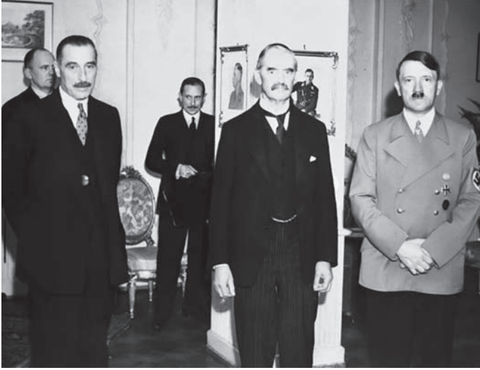
هتلر مع شامبرلن وهندرسون السفير البريطاني.

كبحوا حريتهم العالية على الأحرار ثم أشبعوا نفوسهم المكبوحة بشهوة العدوان على حرية الناس. فكانوا خاسرين في الصفقتين، غادرين بحرمتهم وحرمات من يعتدون عليهم. وبئس التعليم إن كان هذا الصنيع في حاجة إلى تعليم. إنما المعجزة أن تعلم المرء الكرامة فلا يهدر حقوقه ولا يهدر حقوق غيره، وإنما الرجل الكريم كما قلنا في كتابنا عن سعد زغلول من «يسوءه أن يتعرض الآخرون لغضاضة مهينة كما يسوءه أن يتعرض هو لتلك الغضاضة، ويعاف الذل حيث كان ولو لم يمسه في كبرائه، وذلك هو الفرق بين الكرامة المحمودة والخطرة الذميمة؛ فإن الخطرة الذميمة هي التي تستريح إلى إذلال الآخرين ولا تغار على كرامة إنسان، وهي التي لا تميز بين الكبرياء بحق والكبرياء بباطل، ولا تلوم الناس لأنهم اعتدوا عليها مبطلين بل تلومهم لأنهم عرفوا لأنفسهم كرامة ولو كانت صادقة وعلى صواب؛ ولهذا يستخذي المتعطر حين تصدمه القوة من سواه، ولا يزداد الكريم إلا انتصارًا لكرامته حين يمسه من يتناول عليه».