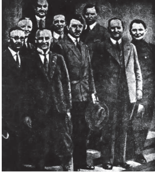
هتلر وأصحابه قبل زهو النجاح.