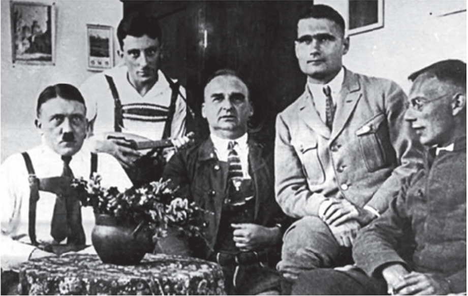
هتلر وزملاؤه في السجن (تلاحظ هدية الزهر التي كانت أمامه).

ولما تبين أن «الجنسية الألمانية» لا تشملها لأنه رعية الحكومة النمساوية، احتالت وزارة برنسويك على الأمر بتعيينه في وظيفة «شرفية» تسمى وظيفة الاستشارة في تلك الحكومة Regierungsrat ليصبح ألماني الجنس بحكم التوظيف؛ وفقاً لدستور فيمار الذي يشمل الجنسية الألمانية كل أجنبي يشغل وظيفة في حكومات الولايات، أو حكومة الريخ الكبرى.