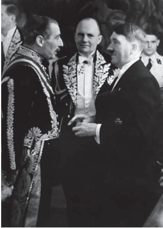
هتلر مع السفير البريطاني.

وقد جمعنا في هذه الصفحات صورًا عدة لهتلر وهو يخطب، أو وهو يغضب؛ لأنه في الحقيقة قلّمًا يخطب إلا ليغضب. فأية صورة من تلك الصور يا ترى يستطيع القارئ أن يكتب تحتها مثلًا: «هذه صورة هتلر يزár أو يزمجرجر؟» إن هذا الكلام ليُكتب تحت صور كثيرة لمصطفى كمال أو لسعد زغلول، ولكن هتلر — على عنايته بصوره واتخاذَه رسامًا خاصًا يتبعه في جميع المحافل ويوزع في أقطار العالم ألوف الصور بل عشرات الألوف منها — لا توجد له صورة واحدة تُخَيَّل