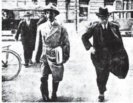
جوبلز «الآري» يحرسه رجال الشحنة.

معرّضاً به: «نحن الألمان نحب صيغة الجمع لغير داعٍ». فنقول مثلاً: إن الأكاذيب قصيرة الأرجل ... لماذا لا نختصر فنقول: إن الأكذوبة لها رجل قصيرة!