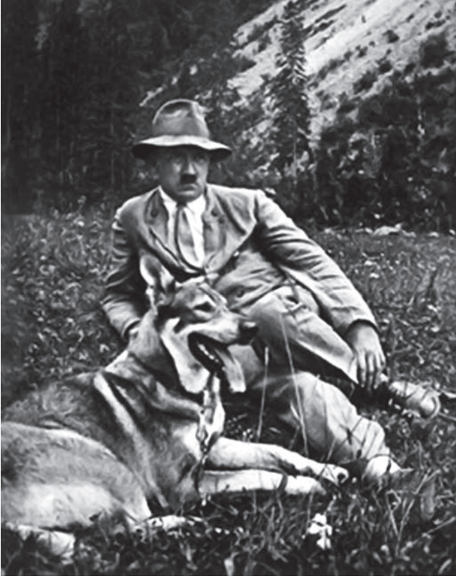
هتلر مع كلبه.

بمجهود عظيم. فلماذا غابت أدلة البر كلها ولم يبقَ لها من دليل في نفس هتلر إلا البر بذكرى أمه؟ وإلا ما يقال من مودته للطفل والكلب والعصفور وهي الخلائق التي يشتري مودتها ولا تكلفه من جانبه مودة إنسانية كبيرة؟ سبب واحد يفسر ذلك أوضح تفسير وأصدق تفسير، وهو أن المودة الإنسانية في نفسه ضعيفة، وأنه لم يكسب إلا مودة