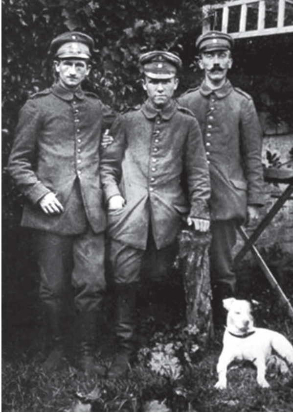
هتلر مع زميلين.

وقد وقع الاختيار على هتلر للمراسلة في مكتب الفرقة المتطوعة فلم يكن من الذين يحضرون حرب الخنادق في جميع الملاحم. وثبت أن الإصابة التي انتقل من جرائها إلى المستشفى قبيل انتهاء الحرب كانت أهون كثيراً من الأخطار التي تعرض لها غيره؛ لأنها كانت إصابة بالغازات المدمعة Lachrymatory gas التي لا تستلزم الالتحام في الهجوم، ولو أنه أصيب بأقوى من هذه الغازات لما سلم نظره ولا زالت آثاره كل الزوال كما ثبت من امتحان عينيه.