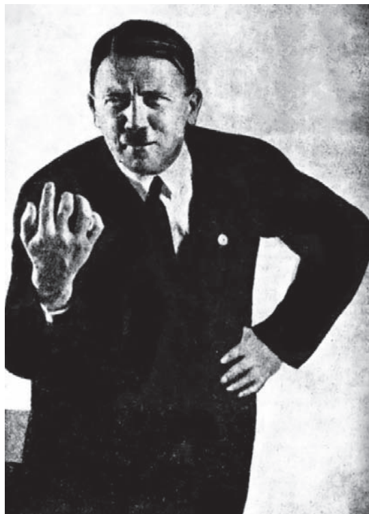
هتلر يوضح نفسه.