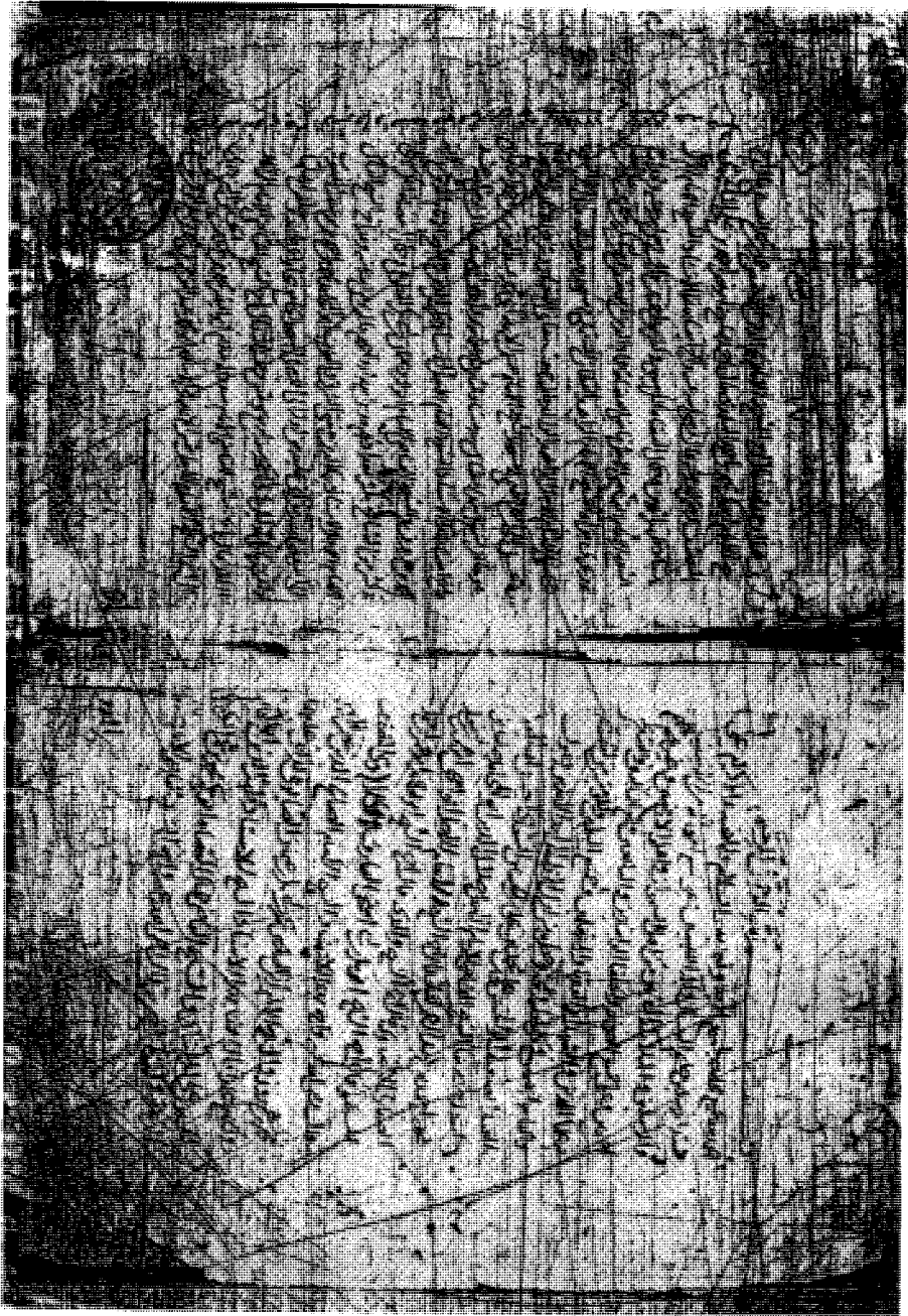
الصفحة الأولى من مخطوطة الأصل