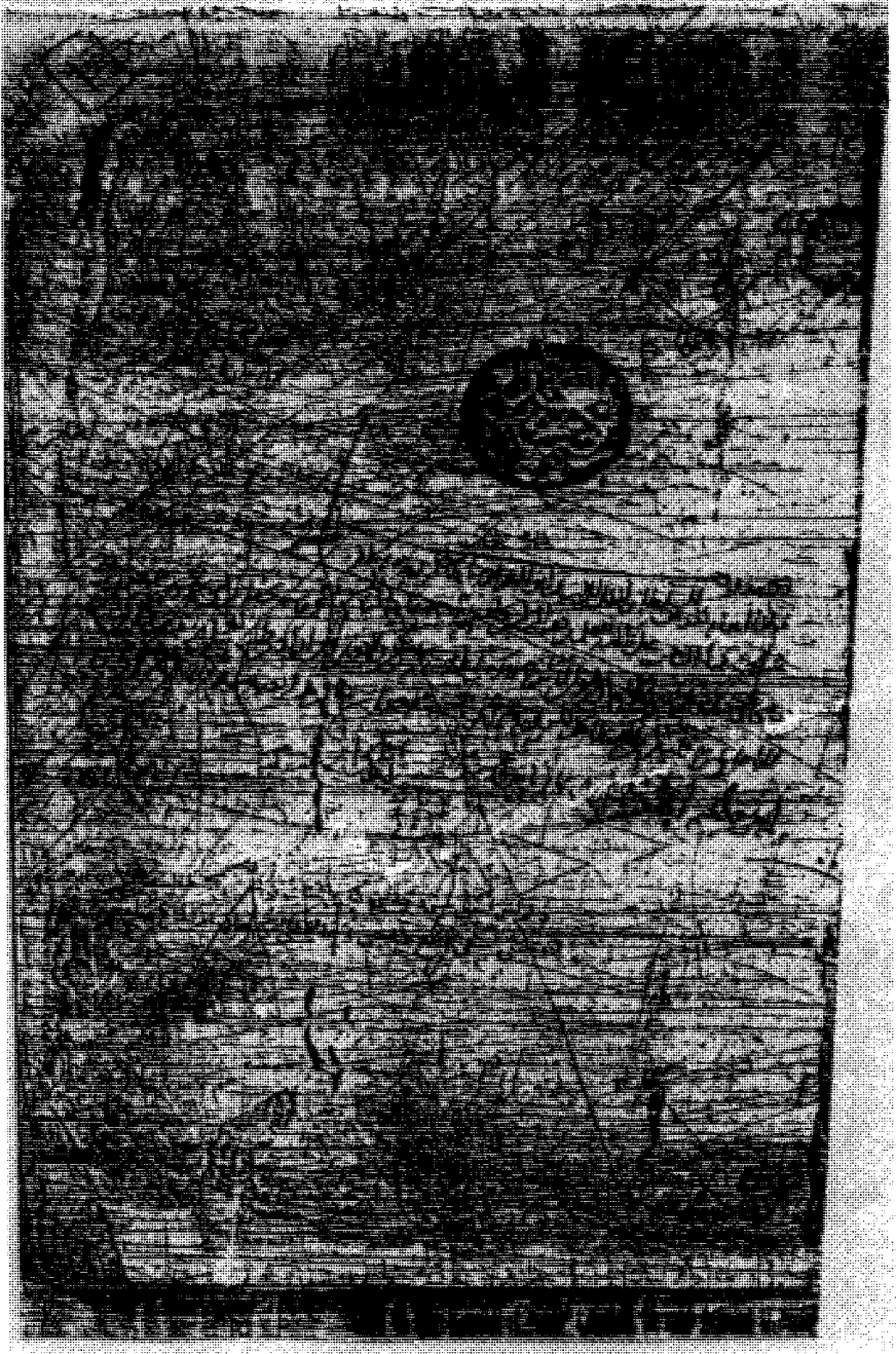
صفحة التملكات من مخطوطة الأصيل