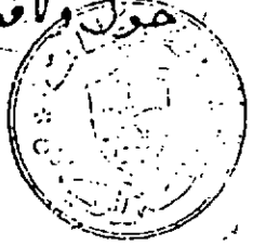
صورة الصفحة الأخيرة من النسخة (ج) المحفوظة بمكتبة جامعة الملك سعود بالرياض.