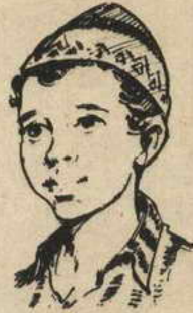
« سمارة »

وصل المغامرون إلى القصر في الثانية بعد الظهر ، للقيام بجولتهم الكشفية ! .. وكانوا يصحبون معهم الثلاثي الذي لا يفارقهم : « روميل » و « مرجان » و « زاهية » : فالكلب الأمين سينبهم بغريزته إذا ما أحاق