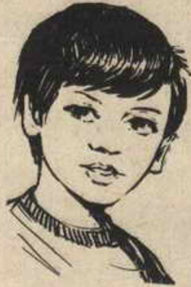
« عارف »

فقد انفتحت بوابة الدوّار فجأة ، واندفع منها العقيد « محسن » ، ومن ورائه معاوناه العملاقان ، والجميع يشهرون مسدساتهم !