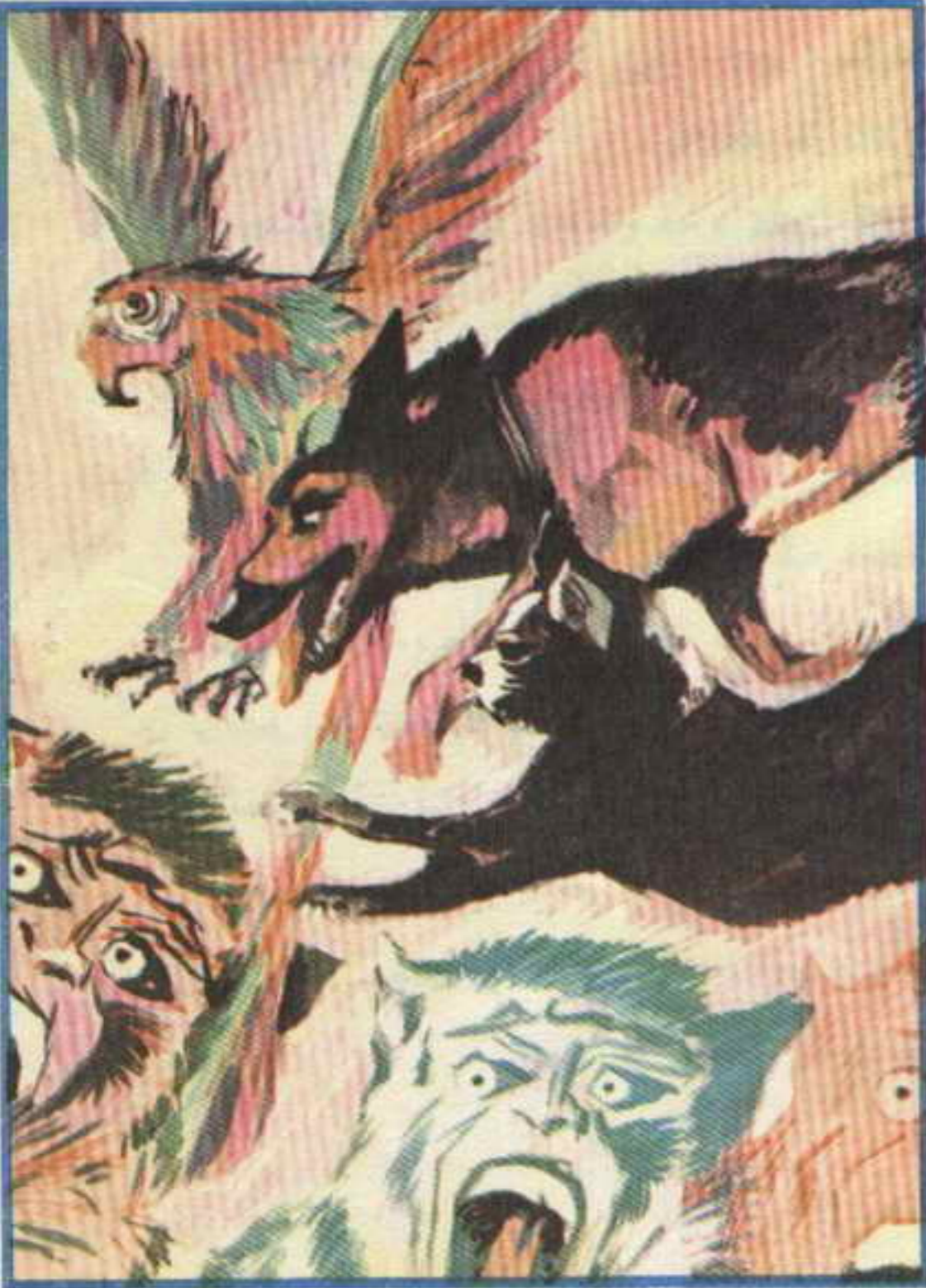
وما أن لمح «روميل» و«مرجان» و«زاهية» «سفروته» حتى أطبقوا عليها ! ! !

وكان «سفروته» قرأت أفكار «عالية» ، فدخلت الحجرة ( ثانية ) وخرجت بسرعة ، وألقت بشيء صغير آخر ! . . فكان حصاناً من الخشب الملون ! . .