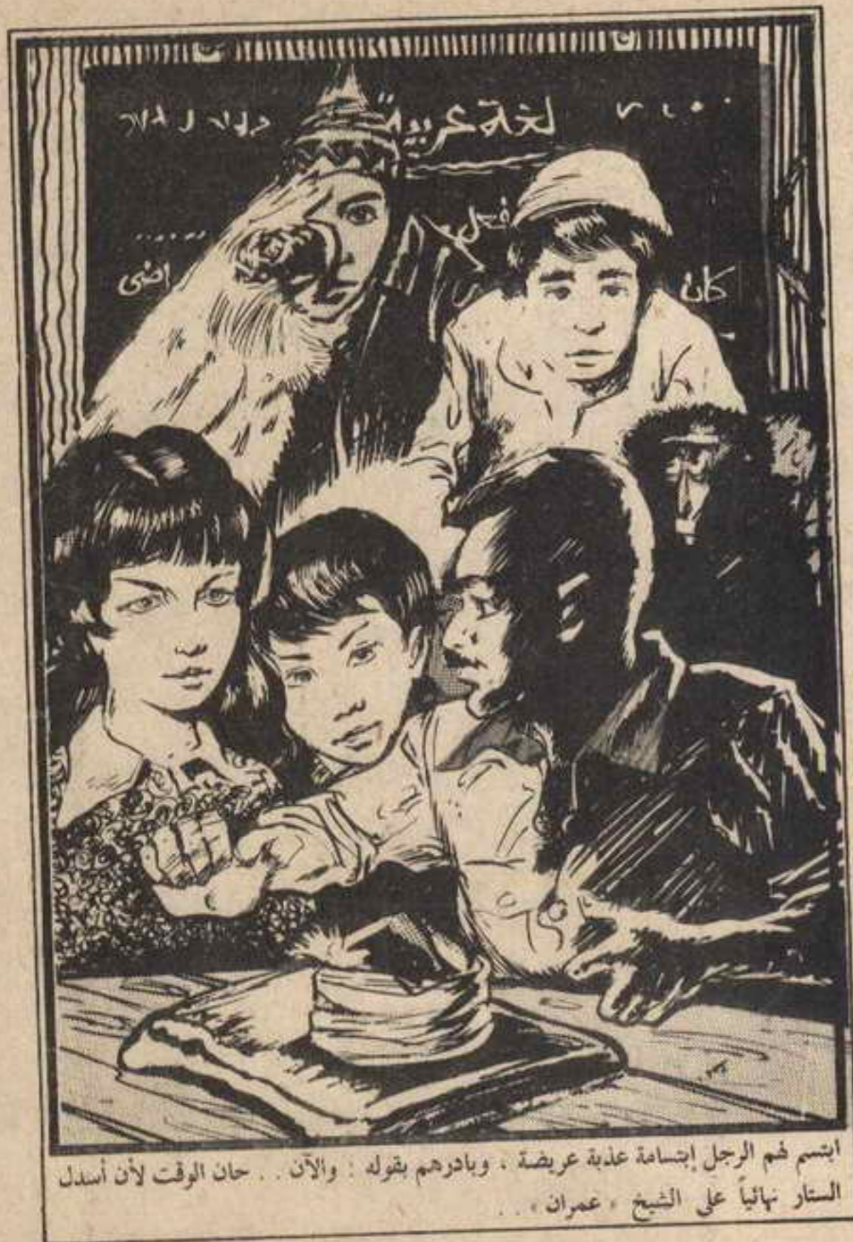
ابتسم ضم الرجل اجسامه عذبة عريضة ، وبادرهم بقوله : والان . . . حان الوقت لأن أسدل الستار نهائياً على الشيخ « عمران » . . .

أستودعكم الله مؤقتاً . . . على وعد بلقاء قريب مع « عامر » . . . !