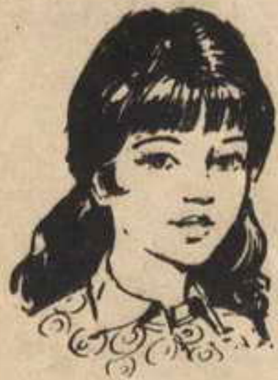
« عالية »

استيقظ المغامرون مبكرين في السادسة صباحاً ، واجتمعوا في حجرة « عالية » ، انتظاراً لوصول « عامر » من القصر ، ولكنه لم يصل في ميعاده المنتظر ! . . وعندما بلغت الثامنة ،