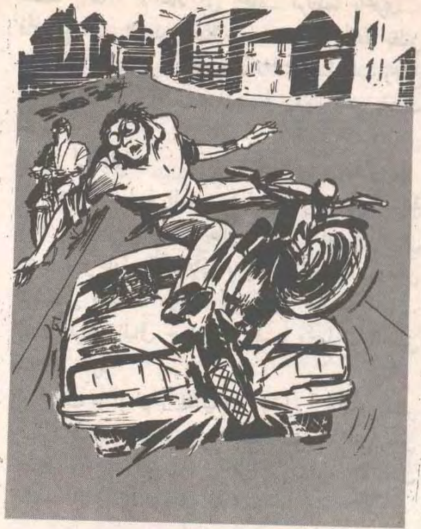
وحاول الانطلاق بدراجته البخارية ، ولكن المرسيدس صدمت دراجته بقوة رهيبية حطمتها تمامًا ..

خبط ( شامير ) على مكتبه بقوة ، وصاح غاضبًا : — أنتم أغبياء .. كيف فشلتم هذه المرة أيضًا ؟ .. هل نجح رجل واحد في التغلب على ست دراجات بخارية يقودها محترفون ؟ .. هل هذا معقول ؟