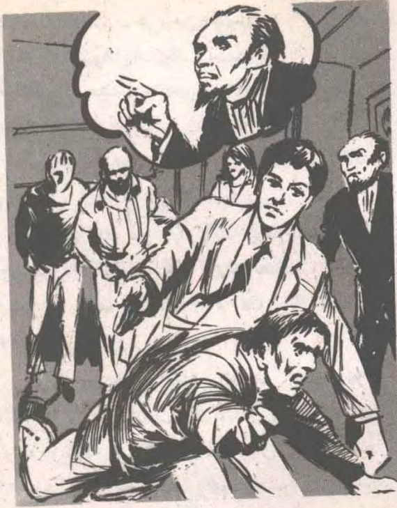
وساعده (أدهم) على السقوط ، بأن وجهه إلى مؤخرة رأسه الضخم لكمة قوية ، ثم قفز نحو أحد الرجلين ..

— نعم يا هزر (هانز) . هزر (هانز) رأسه ، وقال بنفس الابتسامة الصفراء :