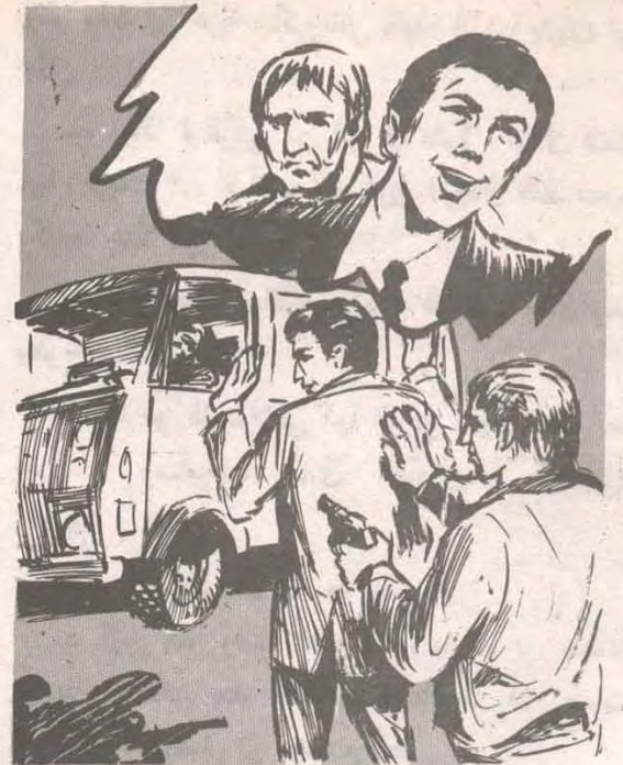
عاد ( أدهم ) يضحك نفس الضحكة الساخرة ، وهو يتجه إلى عربة ميكروباس يقوده إليها ( ياريف ) ..

— ليس هذا وقت الصراع يا ( ياريف ) ، ستملاً الشرطة المكان بعد لحظات ، فلا بد أن صوت الرصاص قد وصل إلى مسامع أحد قطب ( ياريف ) حاجيه ، وضغط أسنانه غيظاً ،