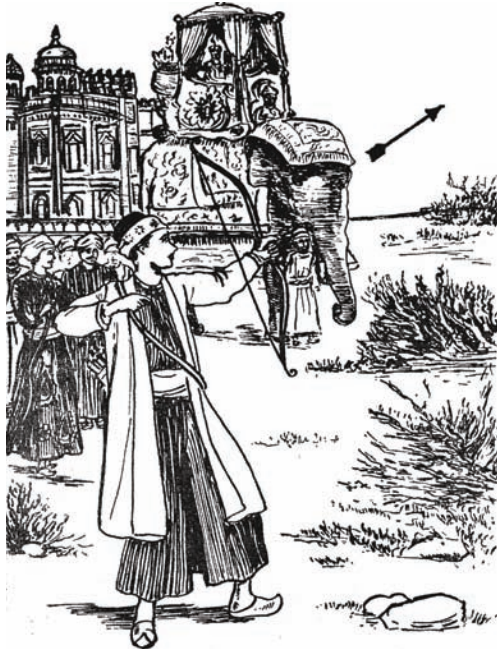
الإخوة يتبارون في إطلاق السهام.

فَقَالَ السُّلْطَانُ «مَحْمُودٌ» لِلْأَمِيرِ «أَحْمَدَ»: «أَنْتَ — كَمَا تَعْلَمُ — أَصْغَرُ أَوْلَادِي، وَلَكَ شَبَابٌ مَرْجُوُّ الْمُسْتَقْبَلِ. وَالشَّبَابُ رَبِيعُ الْعُمُرِ، وَذَخِيرَةُ الْغَدِ، وَهُوَ فَسْحَةُ الْأَمَلِ، وَعِدَّةُ الْجِهَادِ وَالْبِنَاءِ وَالْعَمَلِ، وَلِذَلِكَ أَخْتَارُ لَكَ يَا بَنِيَّ أَنْ تَحْلِفَنِي عَلَى وِلَايَةِ الْبَلَدِ وَقِيَادَةِ الْأُمَّةِ، لِيَكُونَ لِلْوَطَنِ الْعَزِيزِ مِنْ شَبَابِكَ قُوَّةٌ وَفَتْوَةٌ، وَهَمَّةٌ وَعِزْمَةٌ». وَالْتَفَتَ السُّلْطَانُ إِلَى الْأَمِيرِ «حُسَيْنٍ» قَائِلًا: «أَنْتَ أَكْبَرُ الْإِخْوَةِ، وَأَنَا أَخْتَارُ لَكَ ثَلَاثَةَ الْكِنُوزِ، لِتُحَسِّنَ الْإِنْتِفَاعَ بِهَا مَا اسْتَطَعْتَ، بِمَا أُوتِيتَ مِنْ وَفُورِ عَقْلِ، وَبُعْدِ نَظَرٍ، مُتَوَحِّيًا فِي كُلِّ عَمَلِكَ، مَصْلَحَةَ النَّاسِ مِنْ حَوْلِكَ».