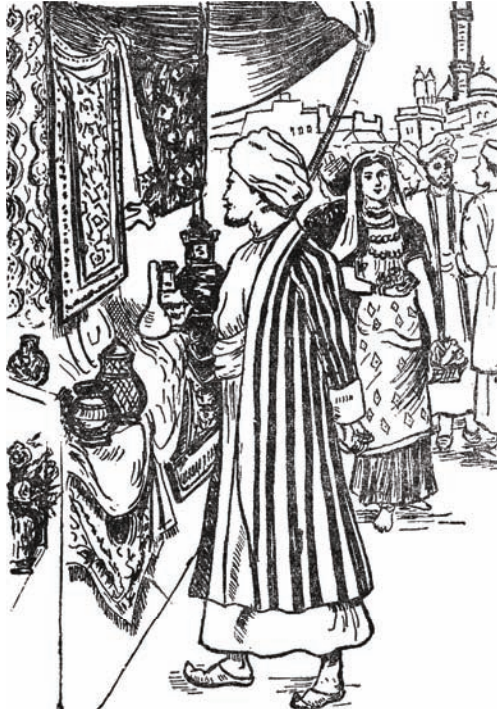
الأمير «حسين» في سوق الثياب.

وَكَانَ أَرِيحُ الْوَرْدُ الذِّكِّيُّ يَفُوحُ فِي كُلِّ مَكَانٍ، فَيُنْعِشُ النُّفُوسَ شَدَاهُ الْمُعْطَرُ، وَلَا يَكَادُ يَخْلُو مِنْهُ بَيْتٌ وَلَا مَتْجَرٌ! وَقَدْ عَرَفَ الْأَمِيرُ أَنَّ أَهْلَ هَذِهِ الْمَدِينَةِ قَدْ بَرَعُوا فِي اسْتِخْرَاجِ الْعُطُورِ مِنَ الْأَزْهَارِ وَالرِّيَّاحِينَ، وَتَقْطِيرِ أَنْوَاعٍ مِنَ السَّوَائِلِ الطَّائِرَةِ ذَاتِ الرَّائِحَةِ الذِّكِّيَّةِ، وَهِيَ سَوَائِلُ سَرِيعَةُ النَّبْخِ، لَا تَكَادُ تَرْتَفِعُ السَّدَادَةُ عَنْ قَنِينَتِهَا حَتَّى يَمَلَأَ الْجَوَّ عِطْرُ فَوَاحٍ. وَسَمِعَ الْأَمِيرُ فِي أَثْنَاءِ أَحَادِيثِهِ مَعَ الْأَهْلِينَ أَنَّهُ كَانَ هُنَاكَ مِنْ بَيْنِهِمْ رَجُلٌ قَضَى عُمُرَهُ كُلَّهُ فِي تِجَارَةِ مُتَوَاصِلَةٍ، أَرَادَ بِهَا أَنْ يَسْتَخْرِجَ مِنْ بُخَارِ النَّبَاتَاتِ وَالْأَعْشَابِ مَادَّةً أَثَرِيَّةً: