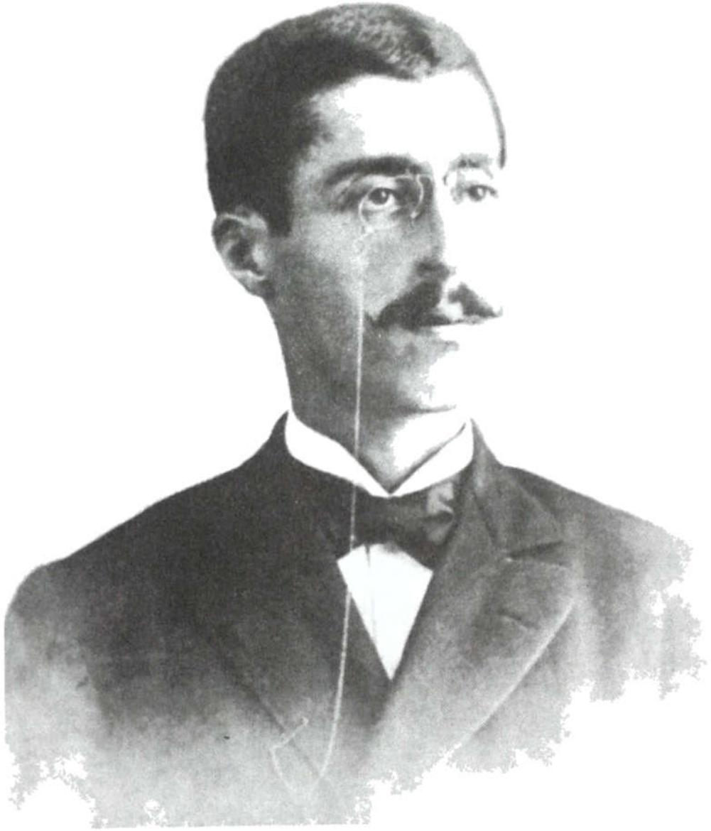
الأمير شكيب في الخامسة والعشرين من عمره - كانون الثاني ١٨٩٥.