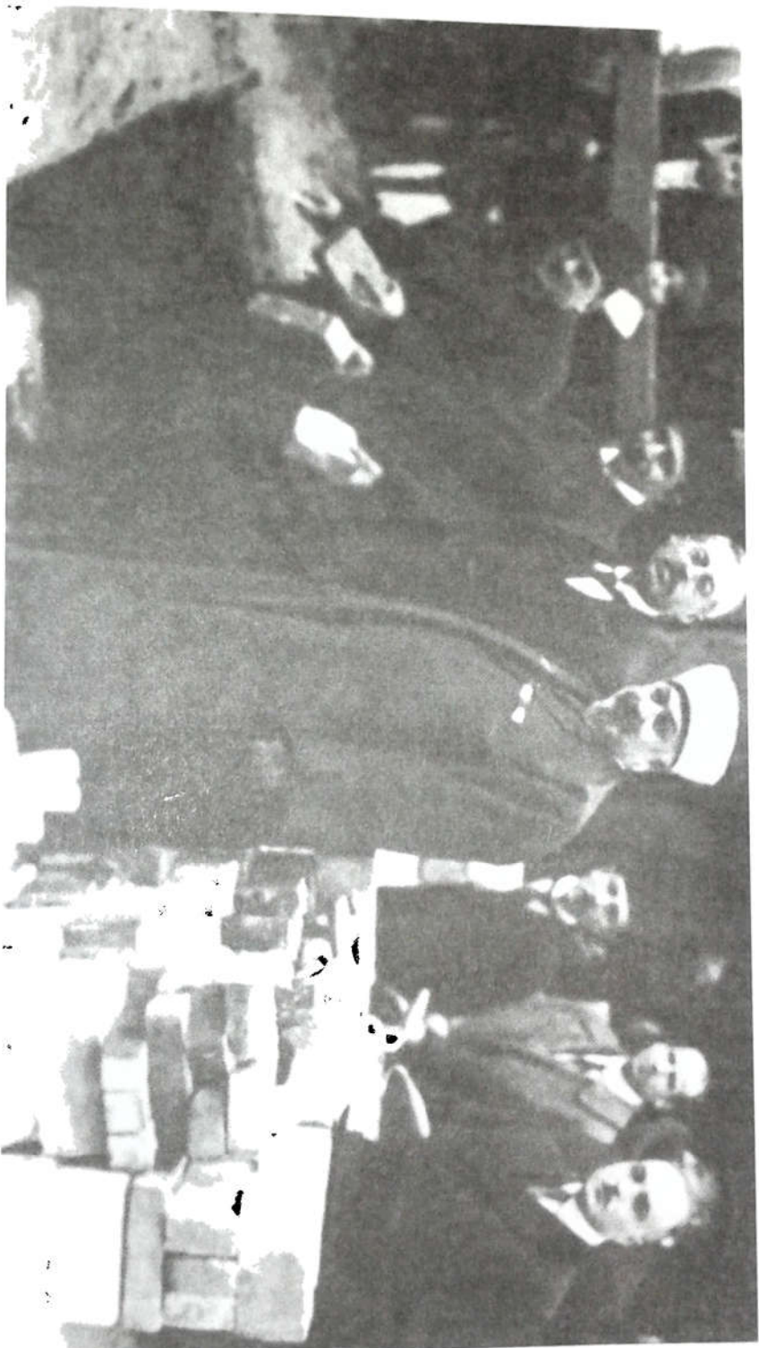
الأمير شكيب، والي يساره الشيخ عبد العزيز جاويز، أثناء تدشين مقبرة المسلمين في برلين عام ١٩٢١.