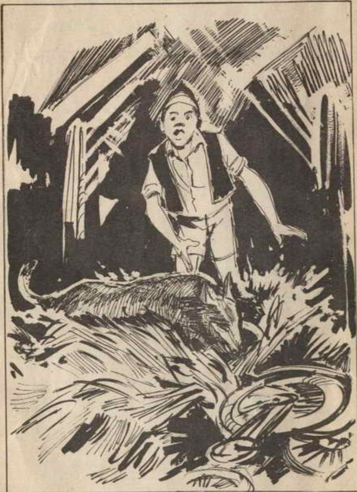
عمل روميل على إزالة كومة القش .. فظهرت تحته الدراجات الثلاث .

عارف : الحمد لله .. لقد عثرنا على دراجاتنا .. عامر : سنتركها هنا كما هي .. وإلا انكشفنا ! .. ووجود الدراجات في هذه البقعة مؤشر طيب ! إننا سوف نعثر على بُعيتنا قريباً !