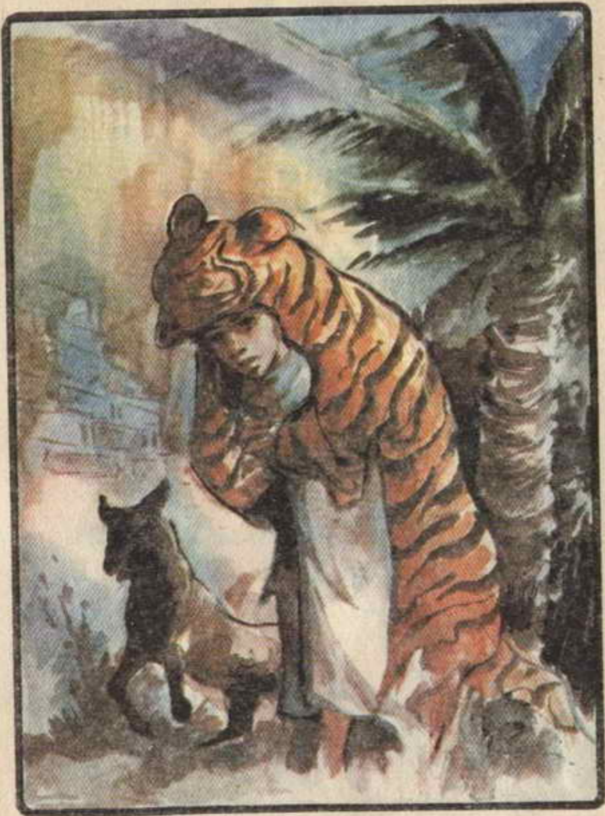
حمل « سارة » جلد النمر على كتفه ، وخرج يترنح به إلى الحديقة وهناك تدثر به كمعطف .

استيقظ « سارة » مدعوراً ، وأزاح « روميل » من على صدره وهو يتأفف ، وقال :