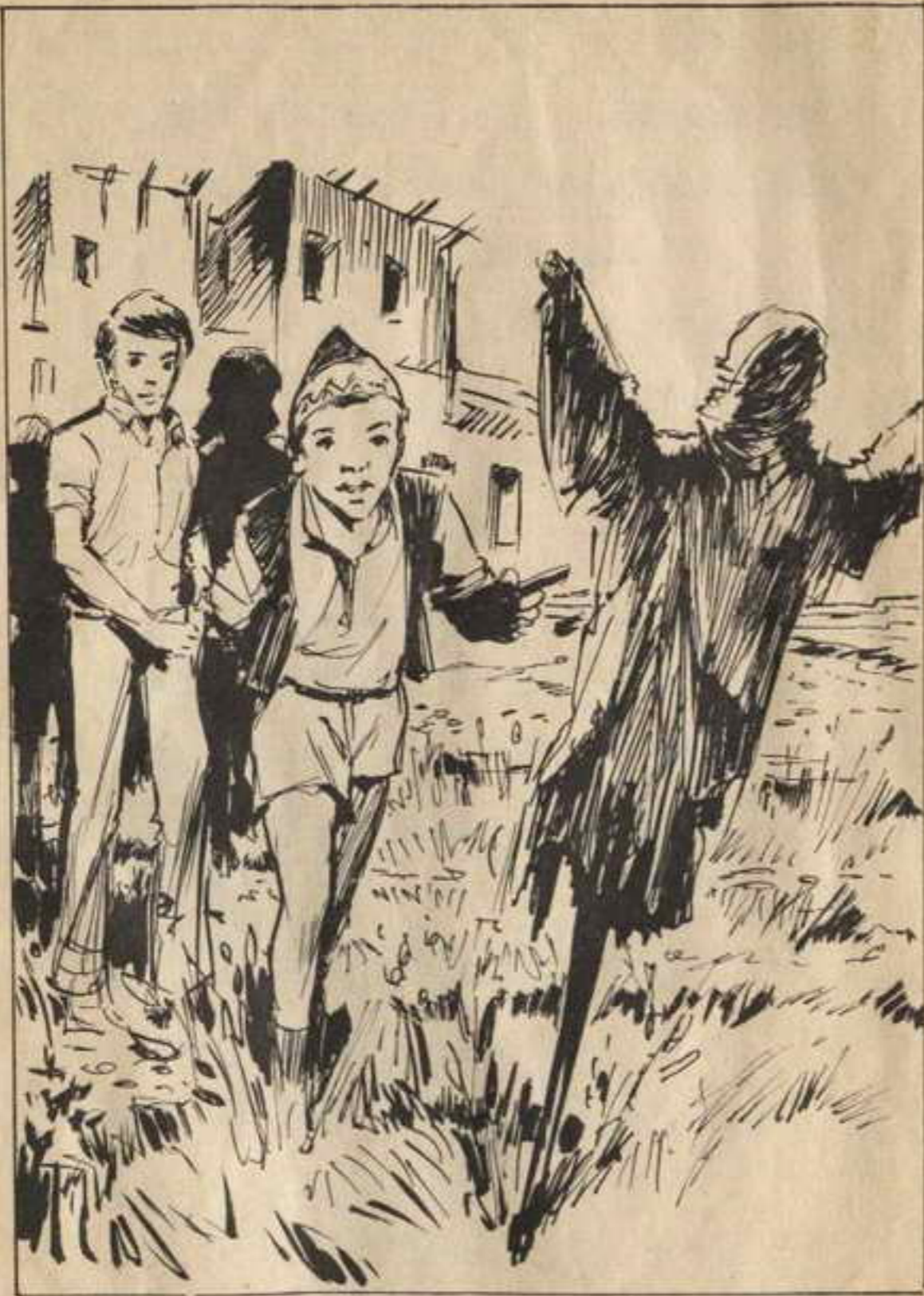
كان أول ما لفت نظرهم هو «خيال اللآة»

عالية : من سيأكل كل هذا يا «أم شلبي» ؟ أم شلبي : أنتم طبعاً . . بعد رجوعكم إلى المنزل من الغيطان ستطلبون المزيد . . هواء الريف يفتح الشهية ! عالية : اعملي معروف يا «أم شلبي» اقفلي الشباك . . الدنيا برد ! أم شلبي : الهواء يدفع الشباك لأن الأكرة مكسورة ! وسأخبر «أبو شلبي» ليرسل لنا من يصلحها . . قالت هذا وتوجّهت ناحية الشباك وأحكمت إغلاقه ، ولكنها ما كادت ترجع إلى «عالية» حتى هبّ الهواء ففتحه ثانية . أم شلبي : على كل حال ياست «عالية» الدار أمان . . وليس في المنزل ما يغرى بالسرقة . . و«الكرار» وبه الخزين مغلق بالمفتاح . عالية : وأين المفتاح ؟ أم شلبي : لا أدري . . يمكن مع الست الكبيرة في مصر ! ! . . ذهبت «عالية» إلى باب «الكرار» الموجود داخل المطبخ وحاولت فتحه ولكنها لم تتمكن من ذلك . . . اندهشت «عالية» من ذلك ! هل سبّهي على والدتهم أن تسلمهم المفتاح قبل سفرهم ؟ أم هي تعلم أن بابه مفتوح ! هذا لا يهم الآن ، فستنجلي الحقيقة عند وصولها بعد أيام ! خرجت «عالية» من المطبخ في طريقها إلى الصلاة ، فوجدت