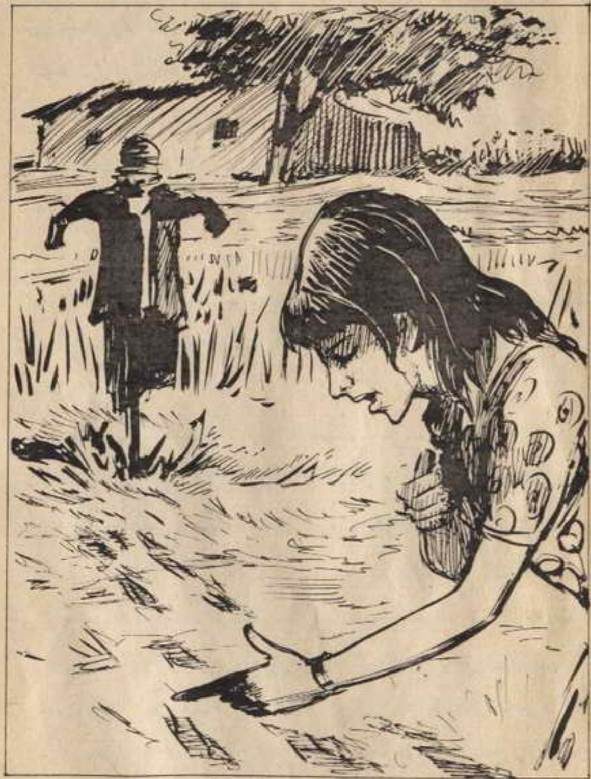
وأخيراً وبعد التدقيق نحت «عالية» آثار قدمين كبيرتين.

عالية : وهذا يعني أن صاحب هذه الآثار لم يعد أدراجه من حيث أتى !! .. أياكون قد هبط علينا من السماء «بالبراشوت» !! ..