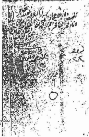
ورقة الغلاف من نسخة بغدادلي وهي - مكتبة سليمانية - استانبول