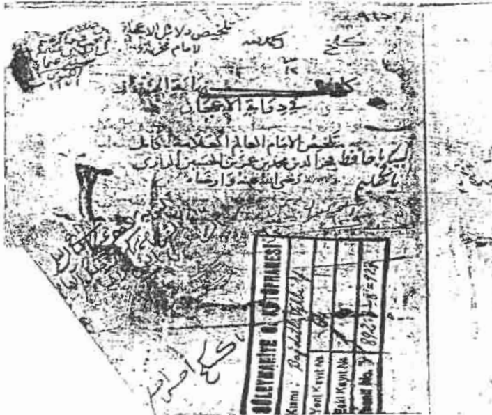
الورقة الأولى من نسخة بغدادلي وهي - مكتبة سليمانية - استانبول