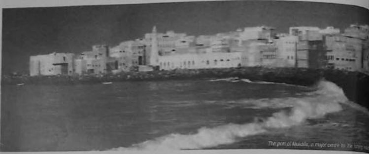
The port of Mukalla, a major centre in the 19th century

مدخل مدينة المكلا عاصمة الدولة القمبية الحضرية من البحر