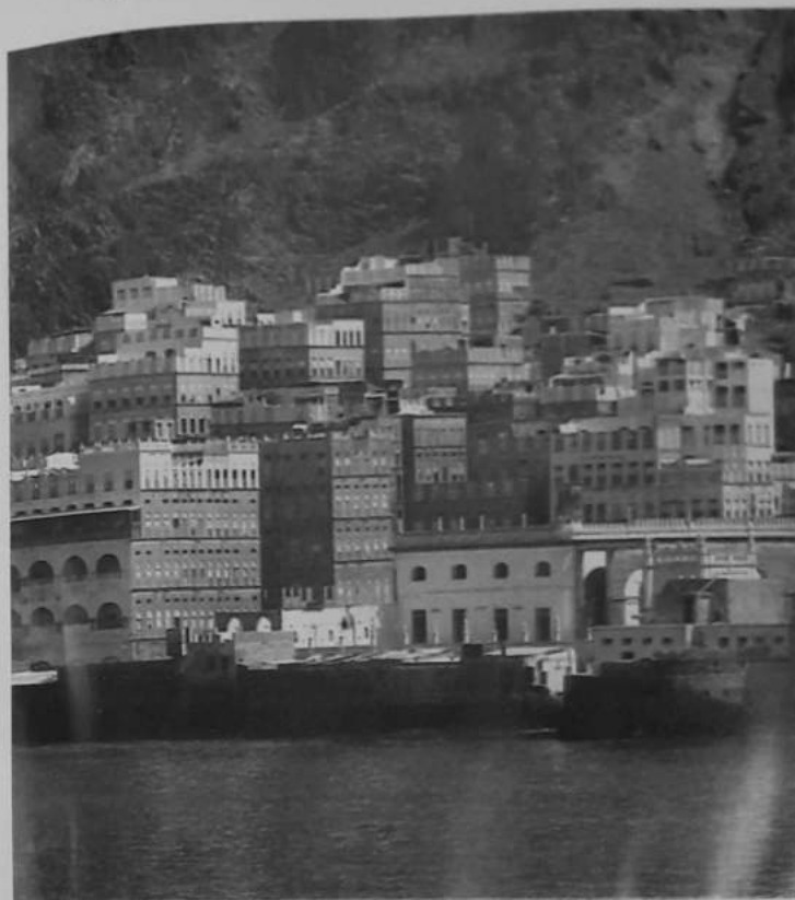
بيوت مدينة المكلا الحجرية الصامدة في وجه البحر منذ قرنين من الزمان