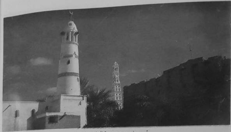
ترجم حضر موت مدينة العلم والعلماء