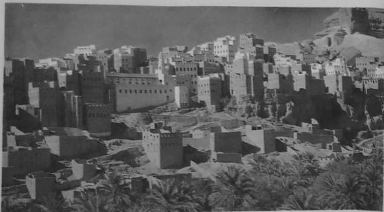
قرية الهجرين بوادي دوغن الشهير بإنتاج العسل