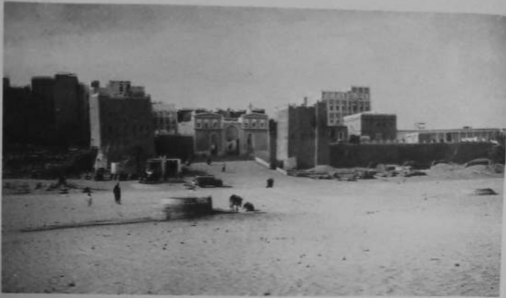
صورة نادرة لمدينة شبام التاريخية يعود تاريخها لما يقرب من مائة عام