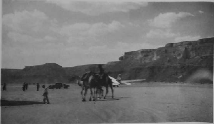
صورة قديمة تجمع وسائل النقل الثلاث في حضر موت الجممل والسيارة والطائرة