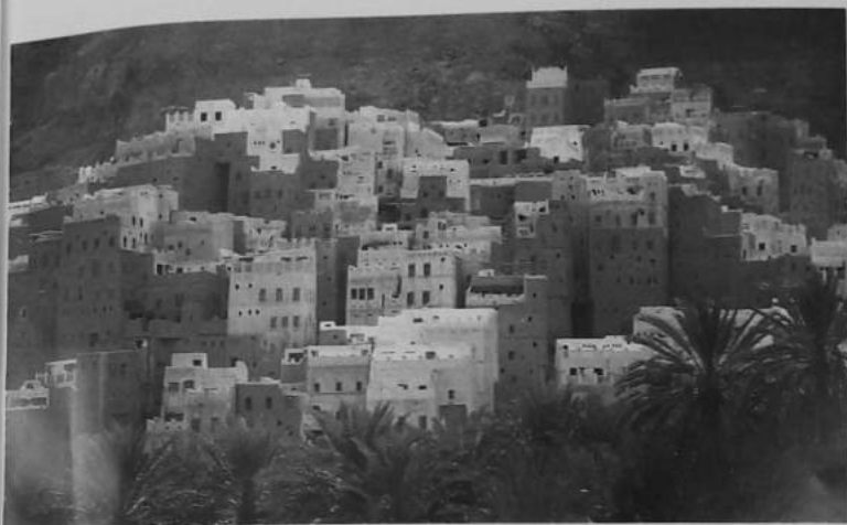
فن العمارة الطينية الصامدة عبر العصور في المدن الحضرمية