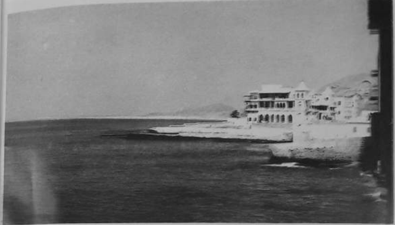
صورة نادرة لقصر سلطان الدولة القعيطية الحضرمية بالملكلا يعود تاريخها لما يزيد عن نصف قرن