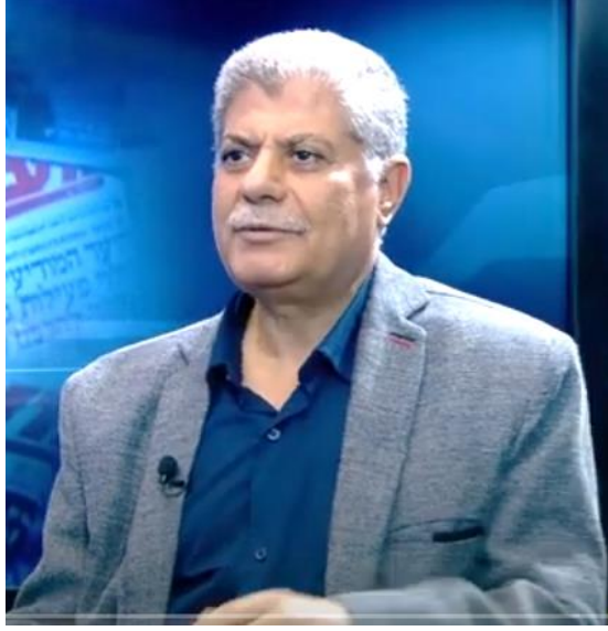
(رجب عطا الطيب)