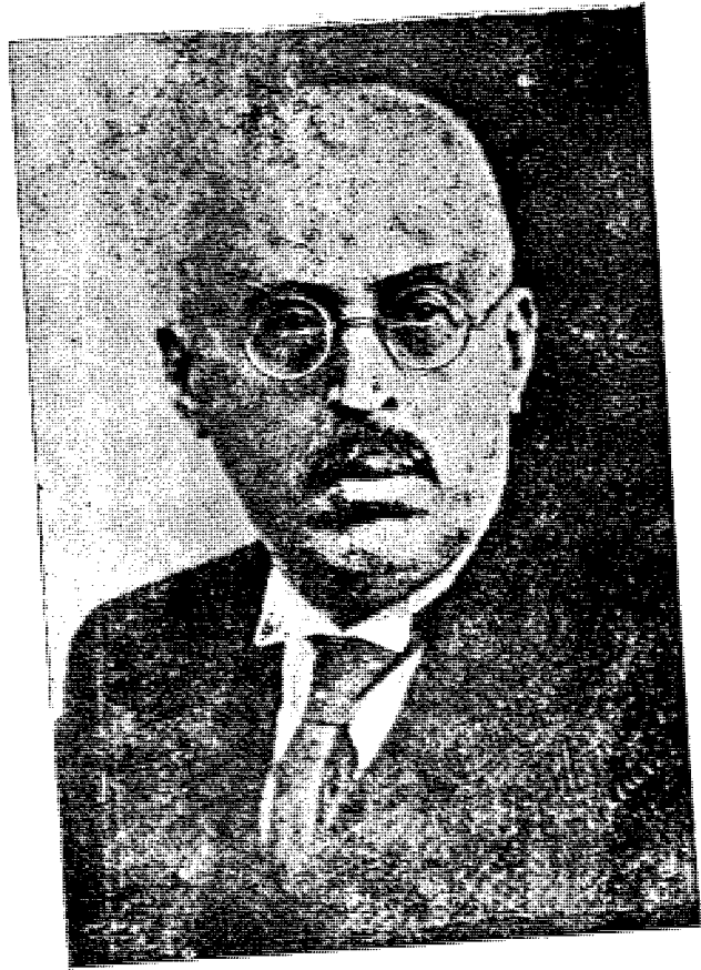
مؤلف الكتاب الابير مكيب ارسلان