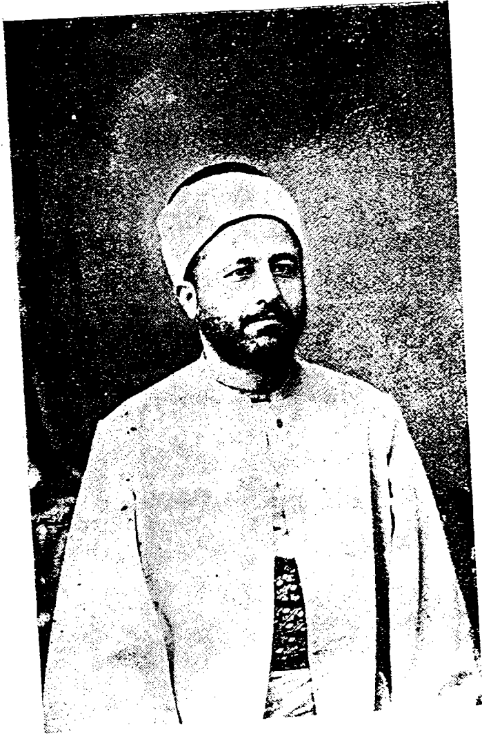
الفتير السبر محمد رشيد رضا بعد هجرته الى مصر سنة ١٣٢٧