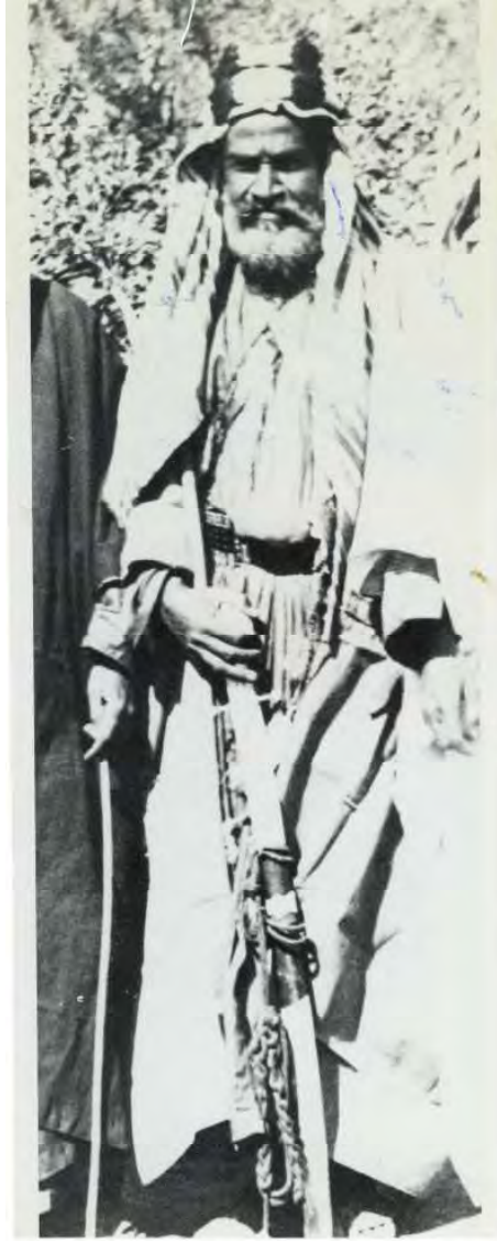
الشيخ حسين بن مبيرك الغانمي الزيبيدي الحربي، أشهر شيوخ حرب المعارضين لثورة الشريف حسين بن علي على الدولة العثمانية، وقد قتل في مكة سنة ١٣٣٦هـ بسبب موقفه