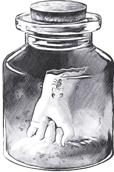
الوعاء المغلق فوق كرسي العرش