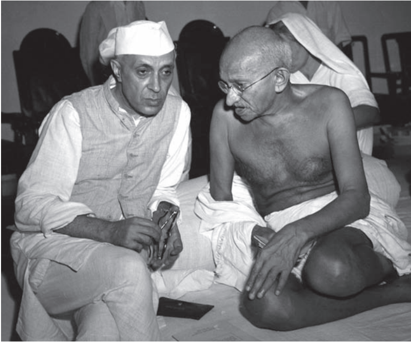
نهر و رئيس الحكومة الهندية يصغي إلى غاندي.

فليكن إخاء بين أحرار، وليدخل في زمرته المنهزمون في ميادين القتال، ولا يعامل أحد من هؤلاء المنهزمين معاملة التشفي والانتقام.