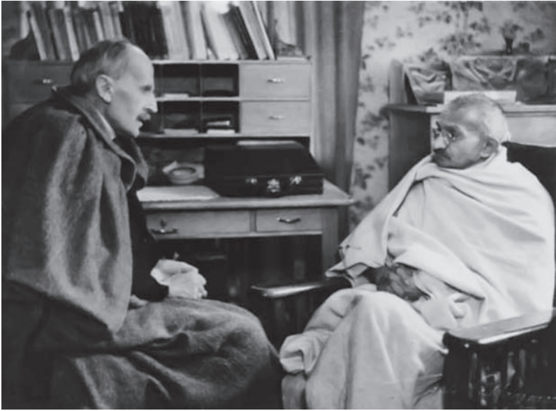
غاندي ورومان رولان.

وإذا كان الإنسان الفرد يجد روحه في كفاح مطالب الجسد وشهواته، فالأمم التي لا عداد لها تجد روحها في كفاح مطالب الحضارة وشهواتها، أو في هذا الصراع الذي يتلاقى فيه الخير بالشر، والقوة بالضعف، والمعرفة والعلم بالجهل والغباء. وما تعلمت الإنسانية من شيء قط كما تعلمت من الشدائد، وفي مقدمتها الحروب، وهي شر ما يبتلى به الناس.