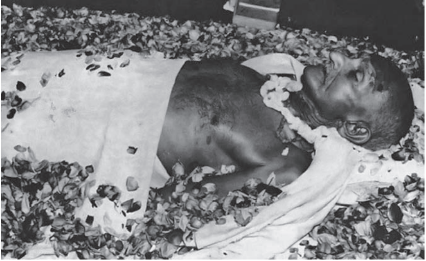
جثمان غاندي على شاطئ النهر المقدس - نهر «جمنا».

غاندي بالصلاة «آي رام. آي رام» ... وسقط إلى الأرض رافعاً يديه كما كان يرفعهما لمن يدعون له بالحياة.