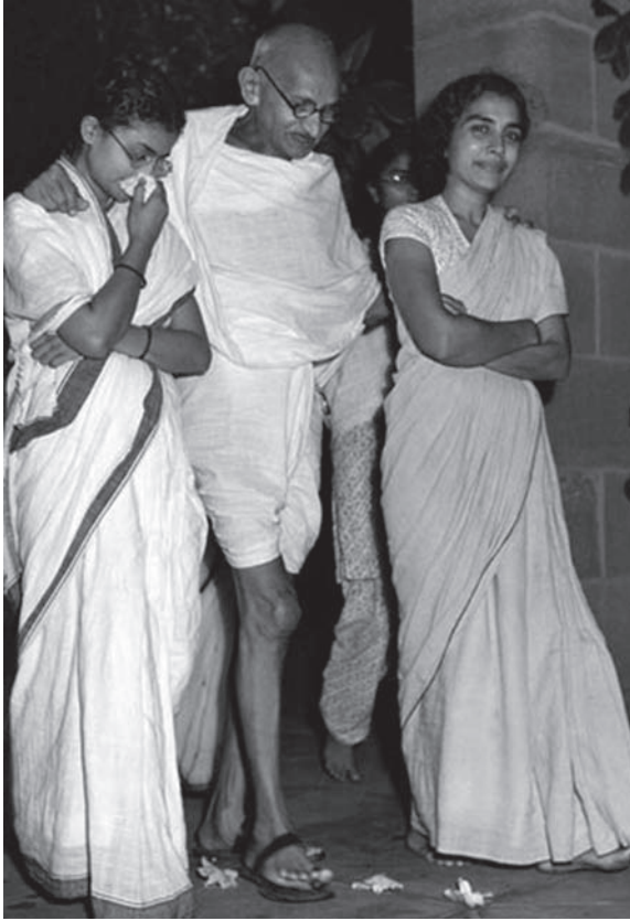
غاندي بين حفيدتيه.

الناحية، وما في كل يوم يجد المسلمون أمامهم زعيمًا كغاندي يعتصم بالسماحة في قوة وصدق طوية، ويستطيع أن يروض أتباعه على العدل والرفق وحسن المعاشرة وفض المشكلات بترضية المخالفين في الرأي والعقيدة.