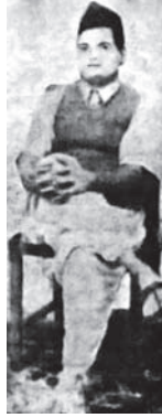
«جودس» قاتل غاندي.

وما نزن أن قاتلاً ضريت نفسه بالشر كما ضريت نفس هذا التعس المفتون، فحسبك نية القتل إذا كان القتل هو غاندي، تلك وحدها كافية.