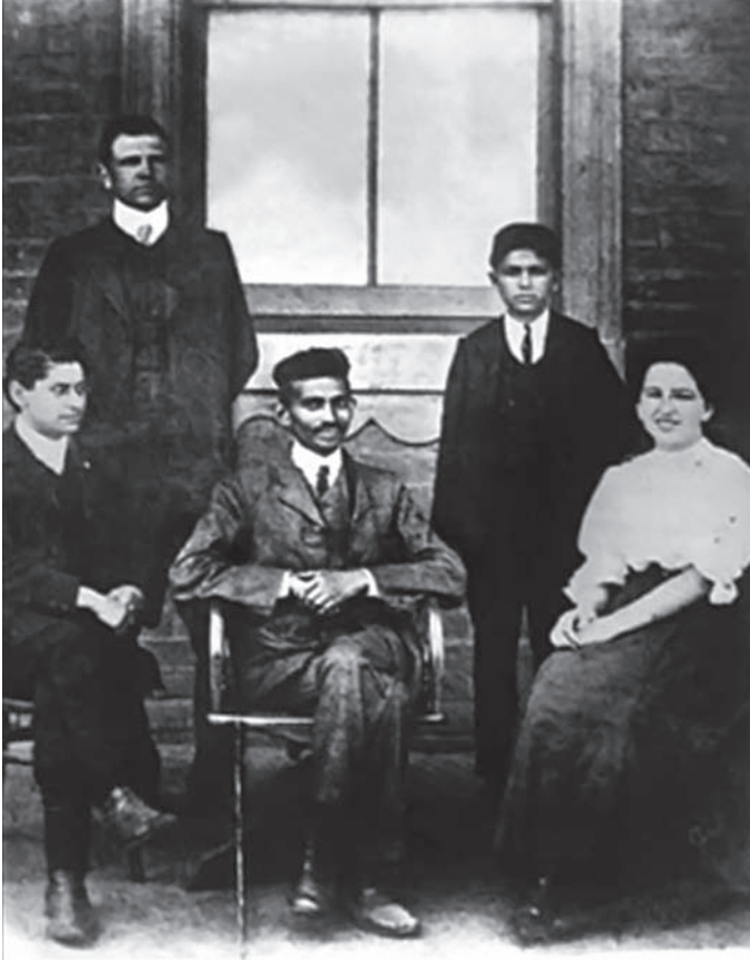
غاندي في أفريقية الجنوبية.

القوانين التي تحجر على حرية العمال الملونين في الإقامة، أو تقتصر عليهم في الأجور، أو تسومهم الطاعة لما لا يطاق من الغبن والإجحاف.