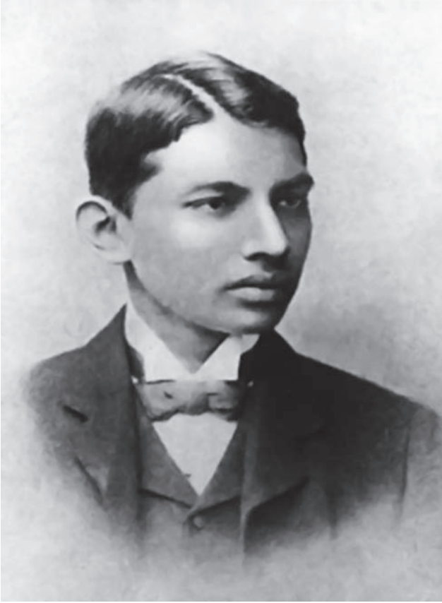
غاندي في الجامعة.

كان بعض الهنود ينقادون لغاندي في حملات المقاومة السلبية؛ لأنهم يؤمنون مثله باجتناب العنف والتورع من إزهاق كل حياة. لكن عمال الجنوب فيهم صينيون وأندونسيون، وفيهم هنود غير مؤمنين بالنحلة التي يؤمن بها الزعيم، وفيهم زنوج ووثنيون لا يعرفون من الأديان غير أديان الهمجية الأولى.