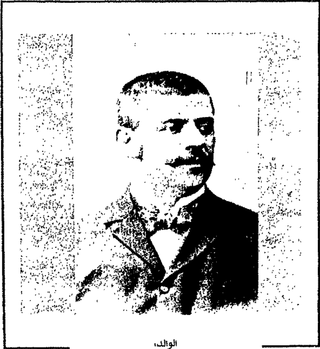
الوالد، هرمان كافكا (في نحو عام ١٨٨٢)