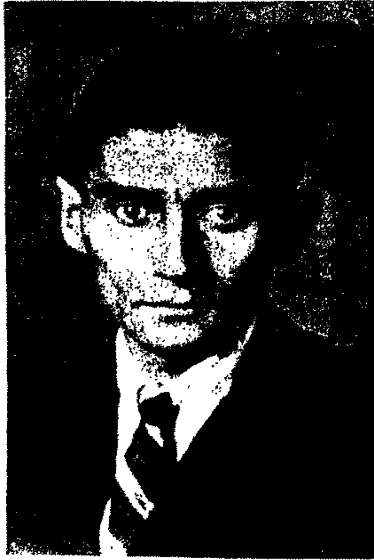
فرانز كافكا آخر صورة (برلين عام ١٩٢٤)