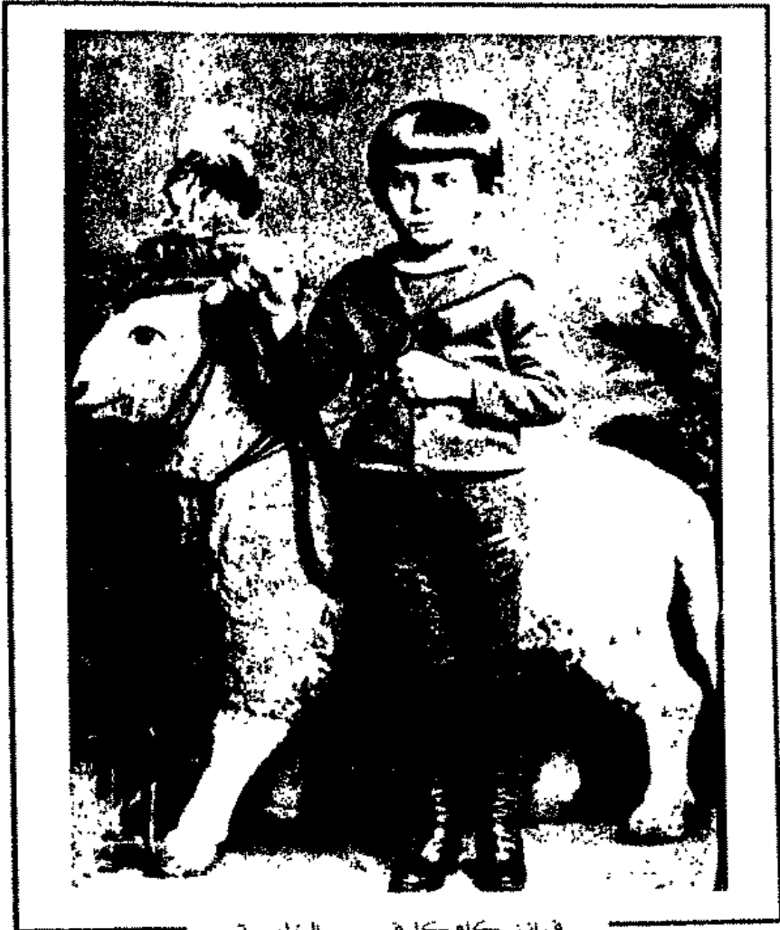
فرانز كافكا في سن الخامسة