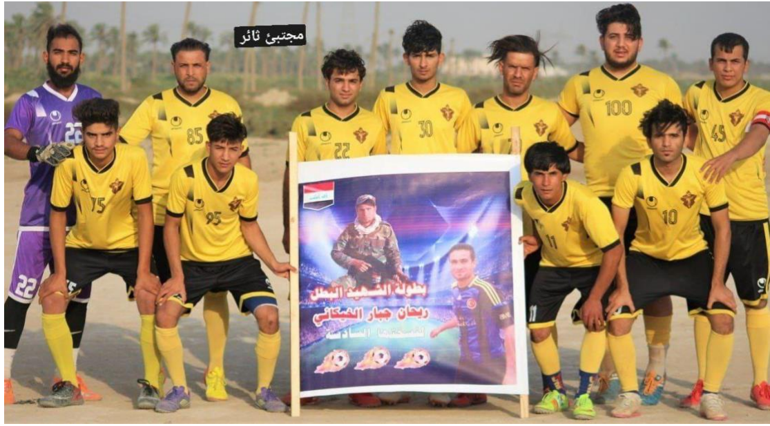
بطولة الشهيد ربحان جبار عودة الخيكاني