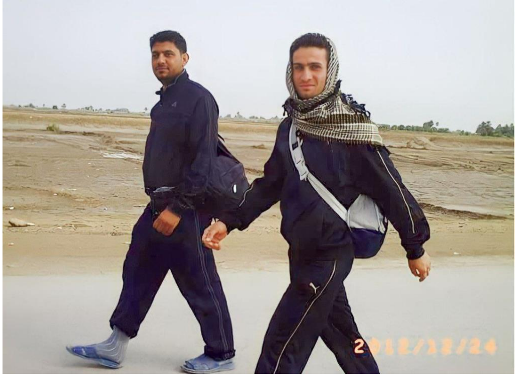
السير إلى أبا الأحرار (ع)