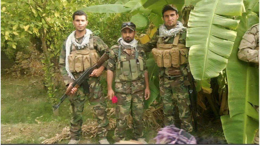
عمليات تحرير جرف الصخر