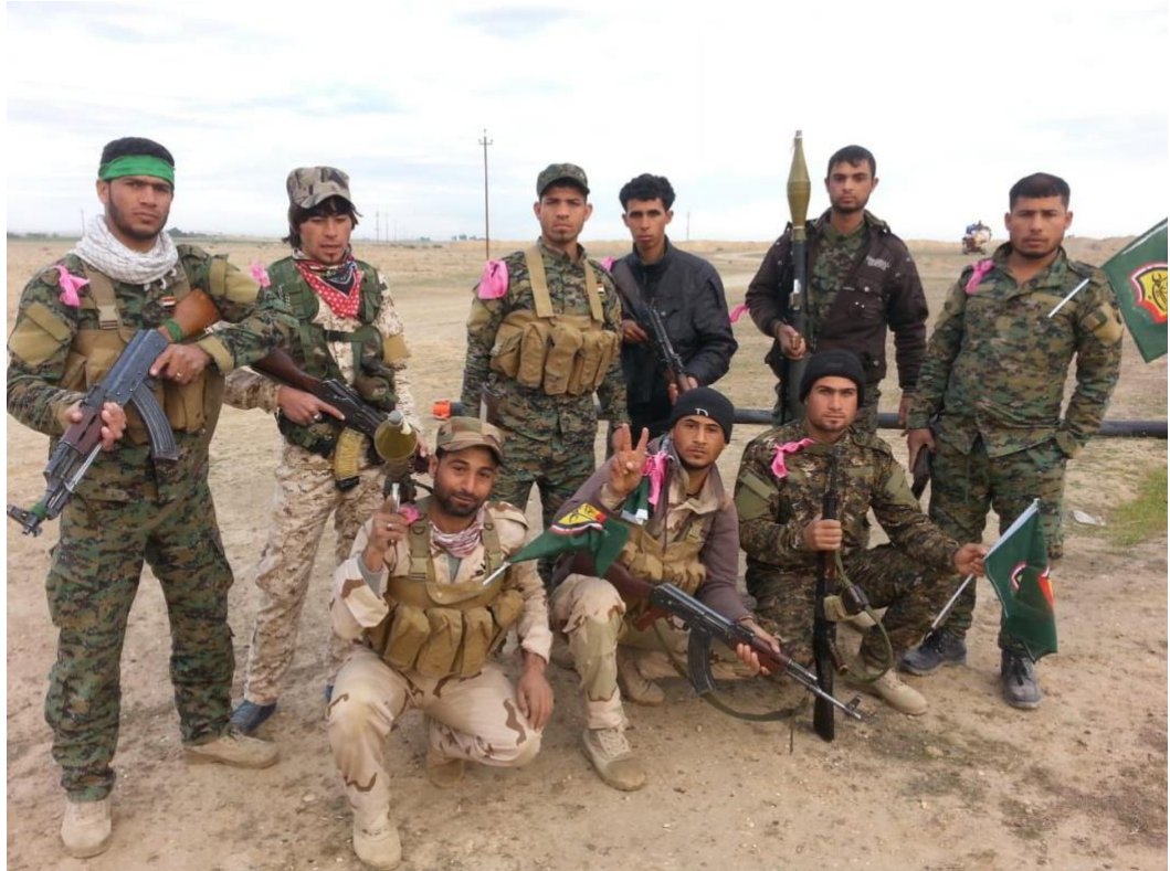
اثناء عمليات تحرير قضاء الدور