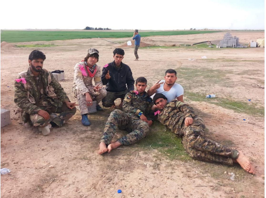
استراحة المجاهدين في قضاء الدور