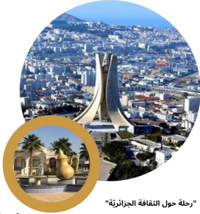
"رحلة حول الثقافة الجزائرية"