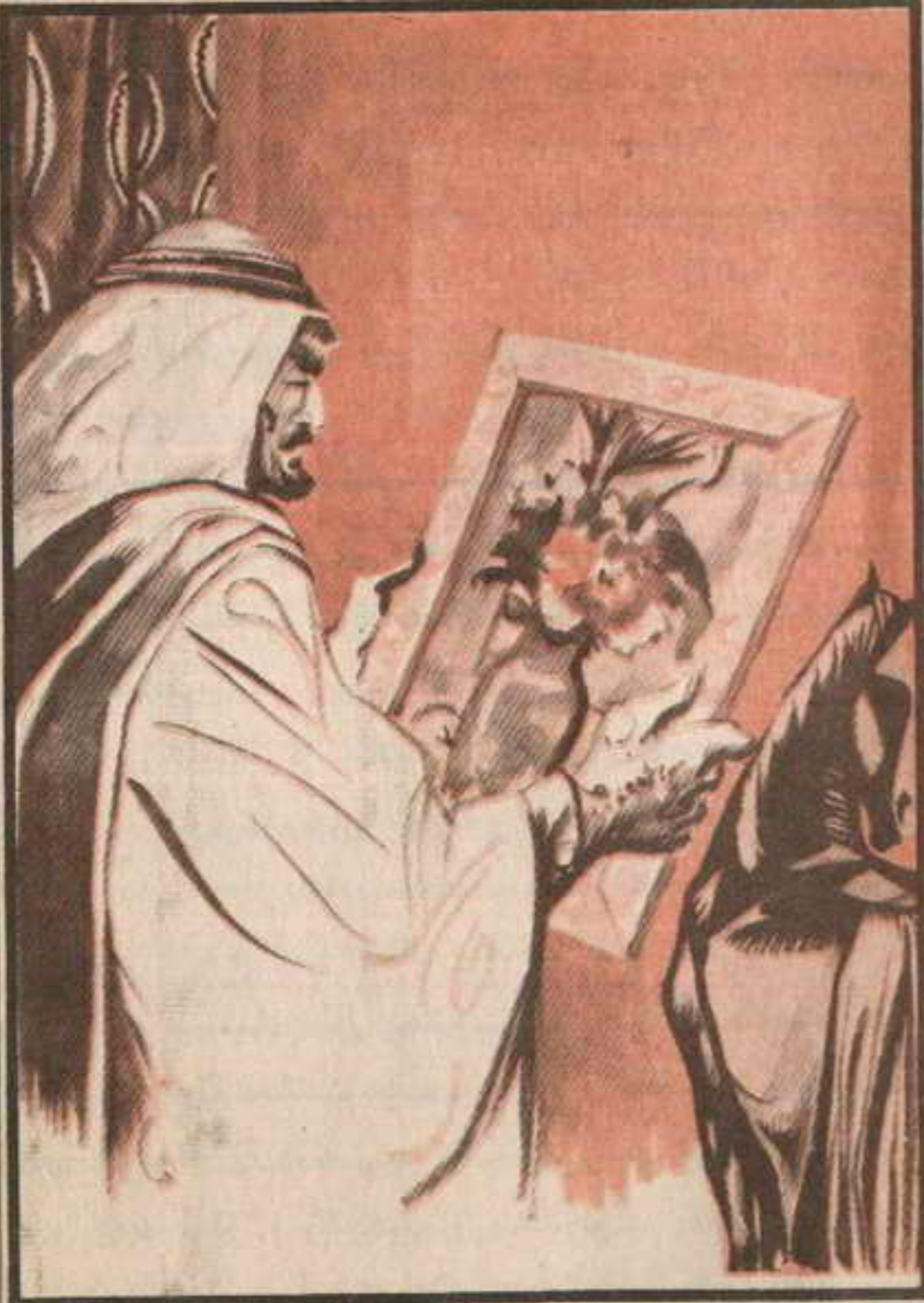
التفت إلى لوحة «سيزان» المعلقة على الجدار .. وقال محدثًا نفسه لا مجال للانتظار ..

وأسرع إلى اللوحة الجميلة .. ذات الحجم الصغير .. والقيمة الكبيرة .. فنزعها من إطارها الذهبي العريض .. ثم لفها بواحدة من الصحف الموضوعة على المنضدة .. واتجه مسرعًا إلى سلم الخدم الذي أفضى به إلى المطبخ .. حيث فوجيء بالطاهية .. تقف أمام